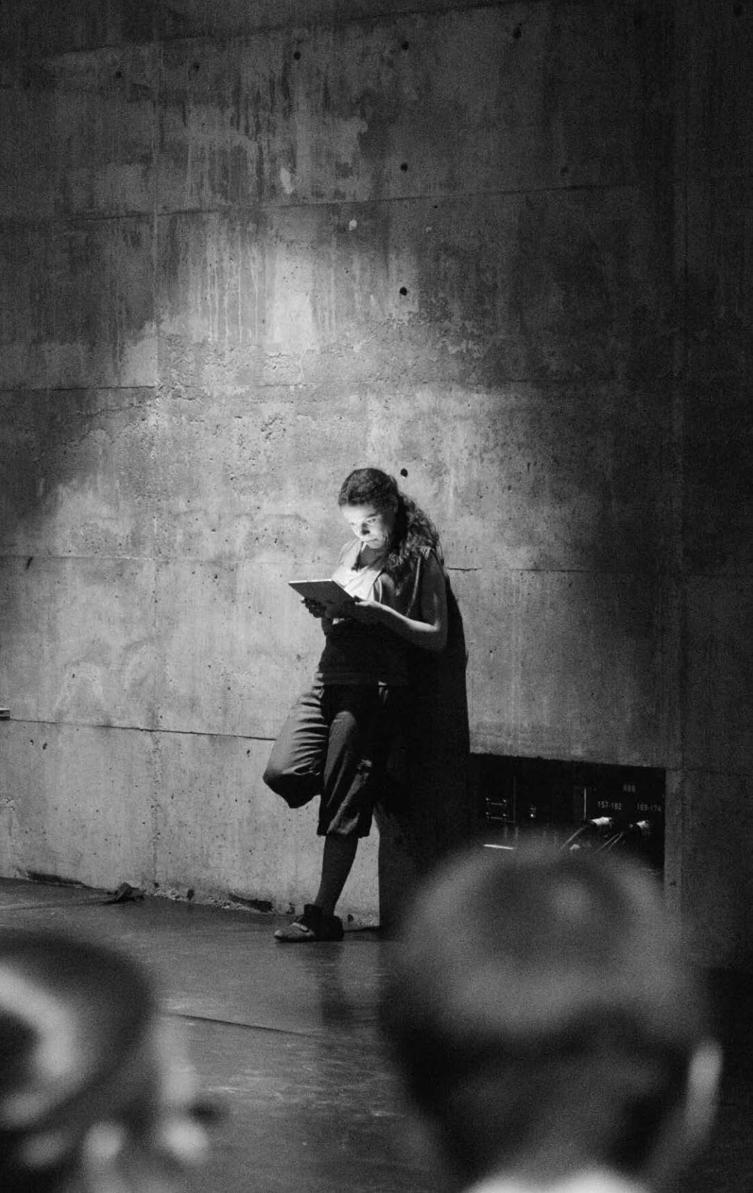
Ronfard nu devant son miroir (NTE, 2011).