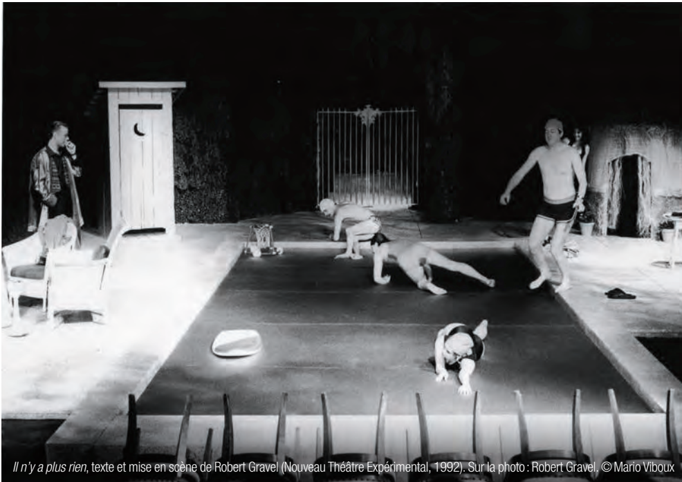
Il n'y a plus rien , texte et mise en scène de Robert Gravel (Nouveau Théâtre Expérimental, 1992). Sur la photo : Robert Gravel

variés. Réflexions d'un acteur désabusé, évaluation du nouveau supermarché, accidents de voiture, analyse de la guerre au Rwanda: les discussions se succèdent dans des dialogues qui s'étiolent sans construire de tension dramatique, à la manière de bien des conversations réelles.