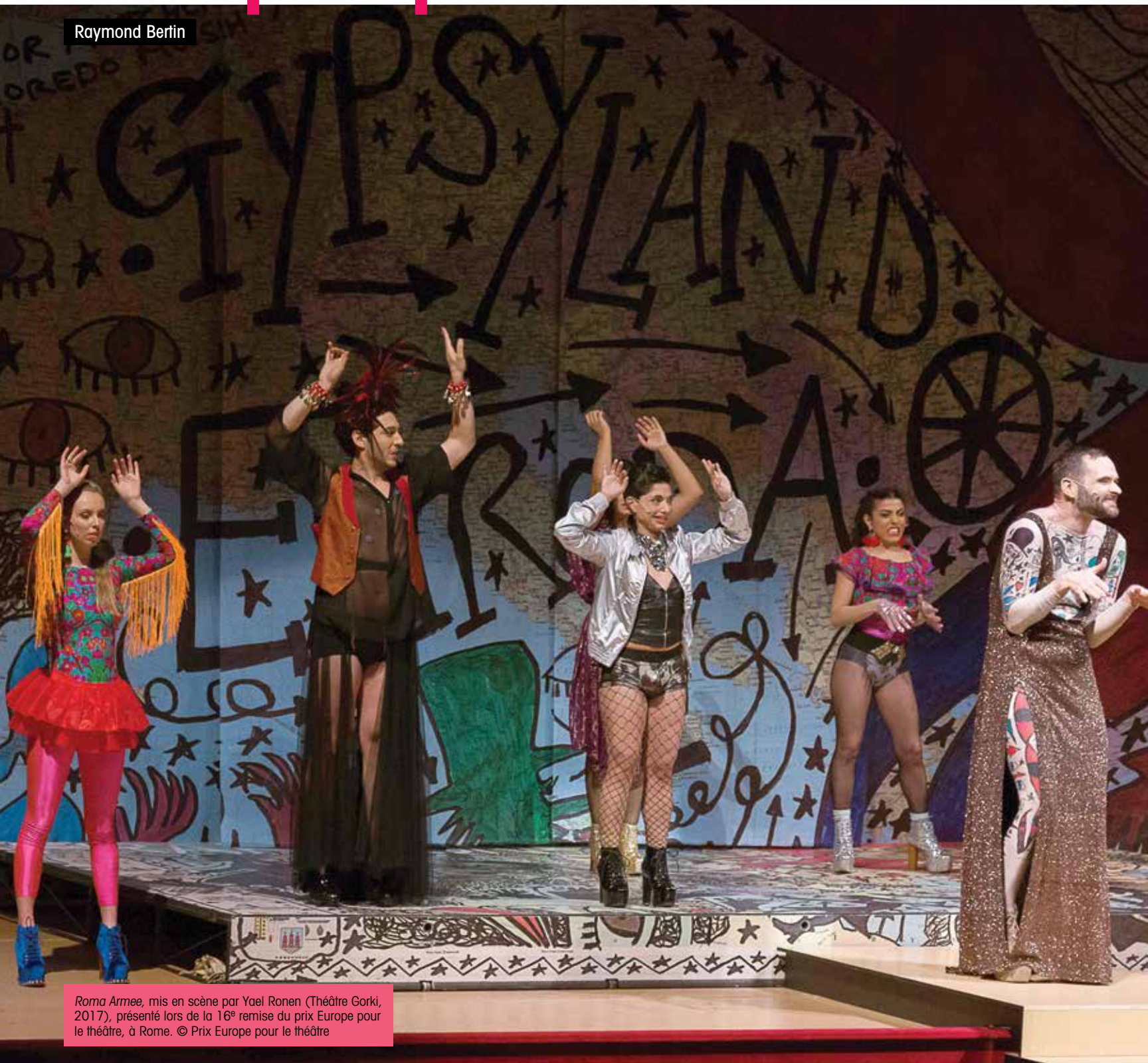
Roma Armea , mis en scène par Yael Ronen (Théâtre Gorki, 2017), présenté lors de la 16 e remise du prix Europe pour le théâtre, à Rome.