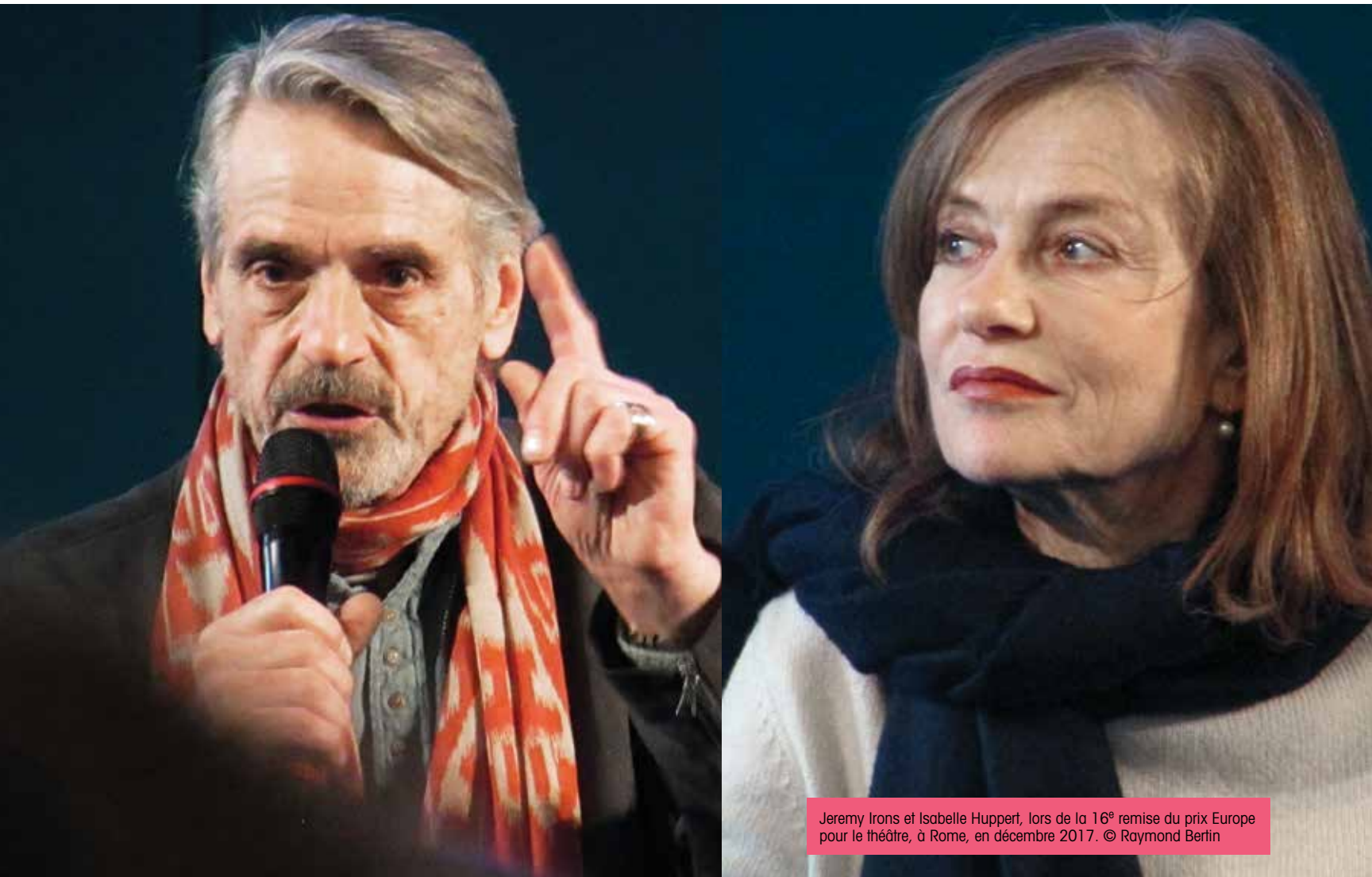
Jeremy Irons et Isabelle Huppert, lors de la 16 e remise du prix Europe pour le théâtre, à Rome, en décembre 2017.