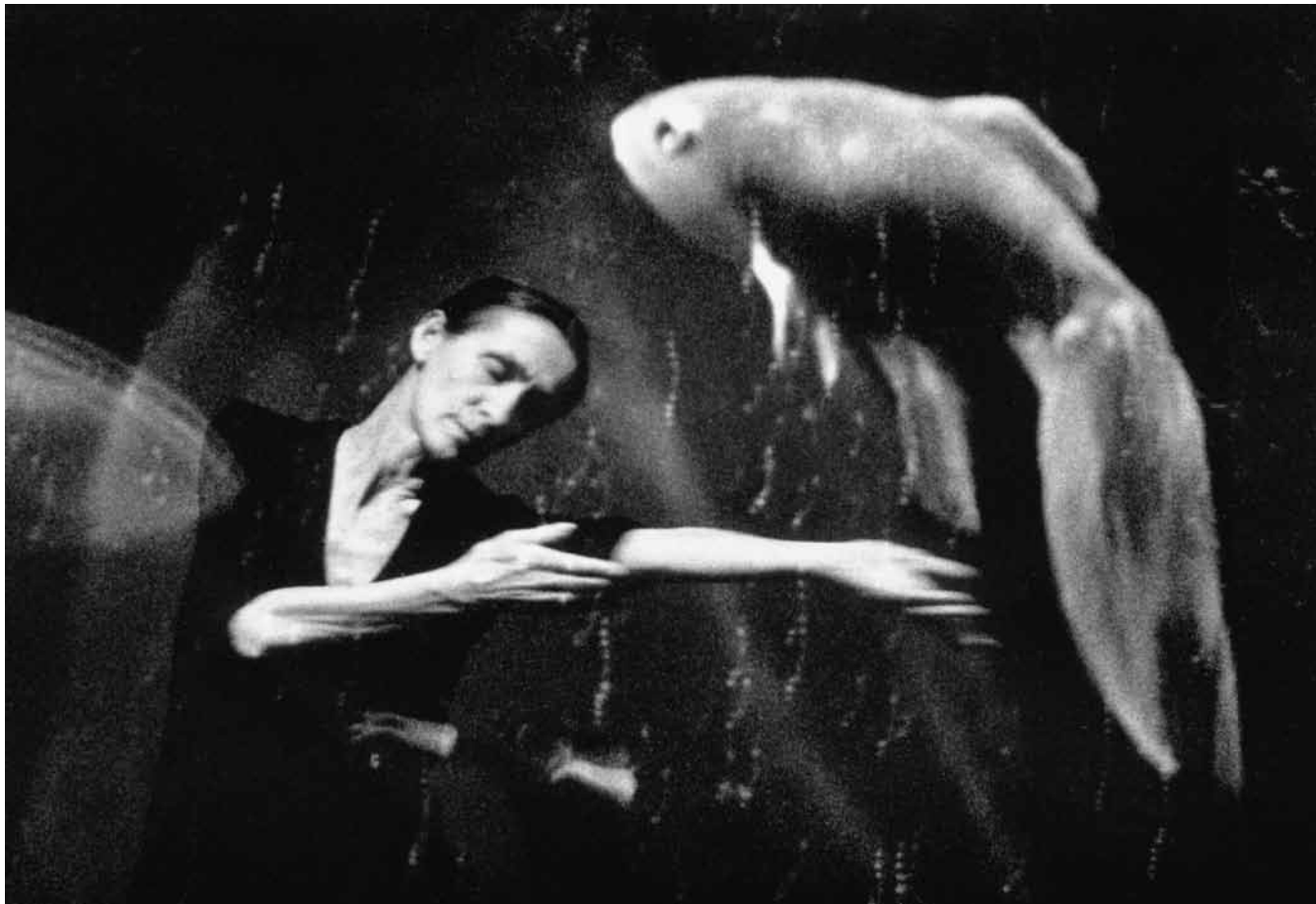
Pina Bausch dans sa pièce Danzón, créée en 1995 à l'Opernhaus de Wuppertal.

Selon cette perspective, sa persistance à interroger le passé avec insistance est souvent interprétée comme un processus visant à expier un legs trop lourd à porter. Dans le questionnement qui fait le propre de sa démarche, dans