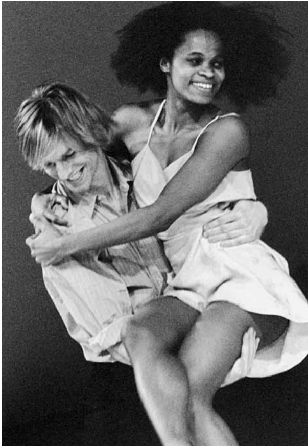
Masurca Fogo de Pina Bausch, créée en 1998 au Schauspielhaus de Wuppertal.

travers ses déplacements les traces mêmes de sa mouvance.