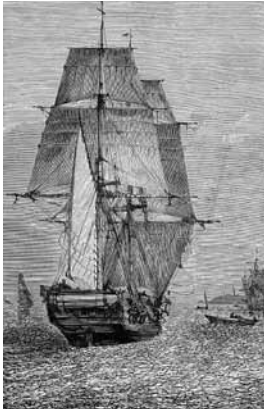
Le Beagle , à bord duquel Darwin et le capitaine Robert Fitzroy voyagèrent autour du monde de 1831 à 1836.

Le collage elliptique propose de manière impressionniste des éléments de débat autour de la modification du génome, du refus du vieillissement ou de l’immortalité, sur un ton ludique. Inévitablement, le propos autour de Darwin nous ramène au cœur de l’espèce. Qu’est-ce qu’un humain ? Le cerveau d’un être humain s’explique comment ? Comment évaluer le statut de l’humain parmi les autres mammifères ? Que nous apportent de doutes, de craintes, de réflexions, les dernières recherches en biologie moléculaire ?