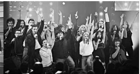
CI-DESSUS : Star Académie 2012.

Et à l'égard de nos organismes, disons-le-nous : le sous-financement est tellement réel que nous nous cannibalisons. L'endoctrinement est tellement profond qu'au nom des principes mêmes qui nous dévorent, le productivisme, la performance, la bureaucratie et la mégalomanie, nous nous entredéchirons, enfants de Cronos devant le gouffre des Titans. Or l'ennemi, ce n'est pas l'autre acronyme associatif. Associons-nous justement, et regardons dans la même direction.