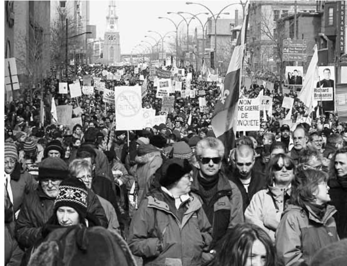
Manifestation à Montréal contre la guerre en Irak, le 15 février 2003.

Les raisons de s'indigner sont nombreuses. Et il y a urgence de le faire. Ce sont les fondements mêmes de notre démocratie et des droits humains qui sont menacés en ce moment au Canada. Pourtant, quand les artistes prennent la parole en public, c'est presque systématiquement pour dénoncer le manque flagrant de financement de notre pratique ou la précarité de nos conditions socioéconomiques. Tout ce que le public entend de nous, c'est qu'on veut plus d'argent. Lorsqu'il y a eu les coupes fédérales dans les aides à la tournée, on n'a