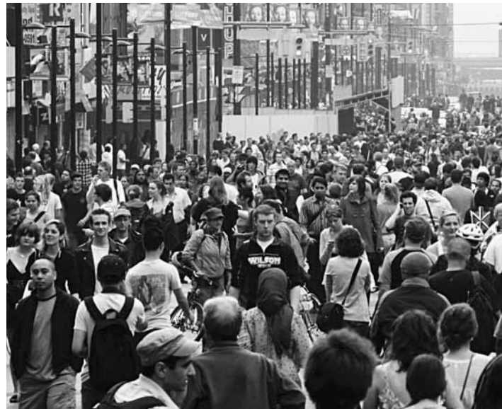
Manifestation lors du Sommet du G20 à Toronto en juin 2010.