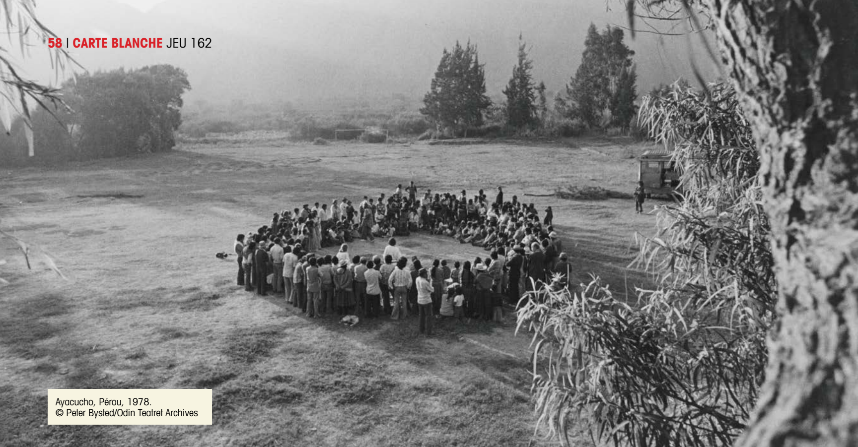
Ayacucho, Pérou, 1978.