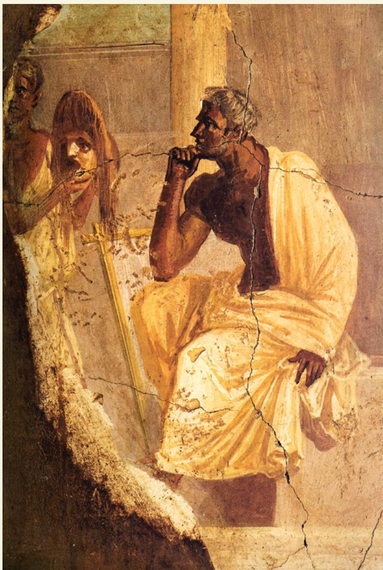
« L'acteur tragique et son masque », IV e style, Pompéi, fresque de la maison de Lucretius Frontus.

Passer par la fiction pour atteindre la vérité, se mesurer à la nature pour construire son artifice, fondre sans confondre son identité et son rôle, faire acte de présence tout en étant un autre, tout cela fait du jeu une forme d'art sans forme, une proposition sans autre contenu que sa propre substance.