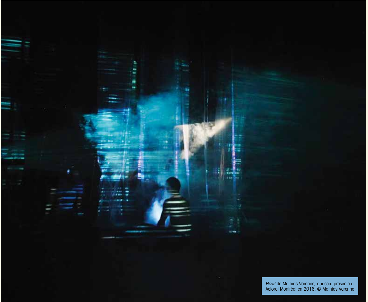
Howl de Mathias Varenne, qui sera présenté à Actoral Montréal en 2016. © Mathias Varenne