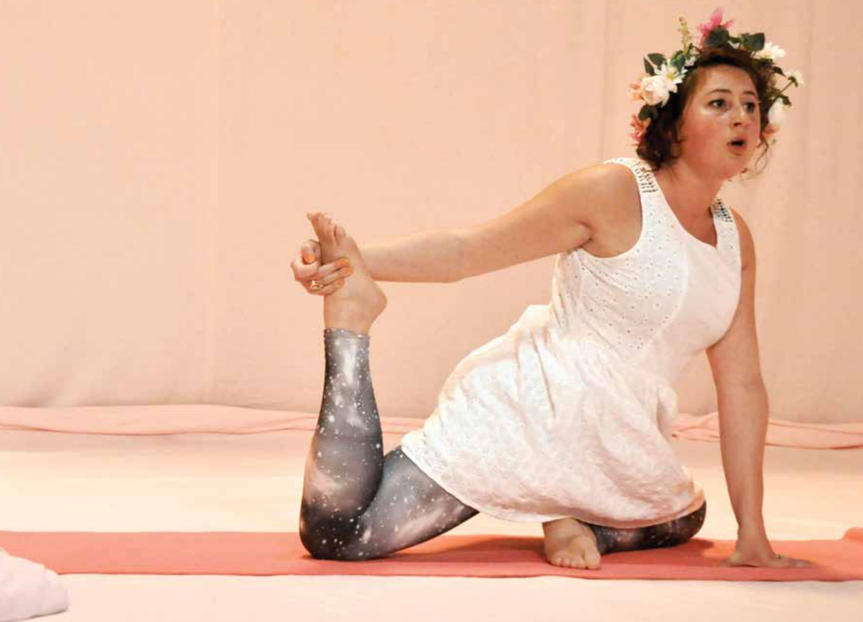
Fire of emotions de Pamina de Coulon, qui sera présenté à Actoral Montréal en 2016.

Les échanges avec Danièle me permettent aussi de regarder les choses autrement. »