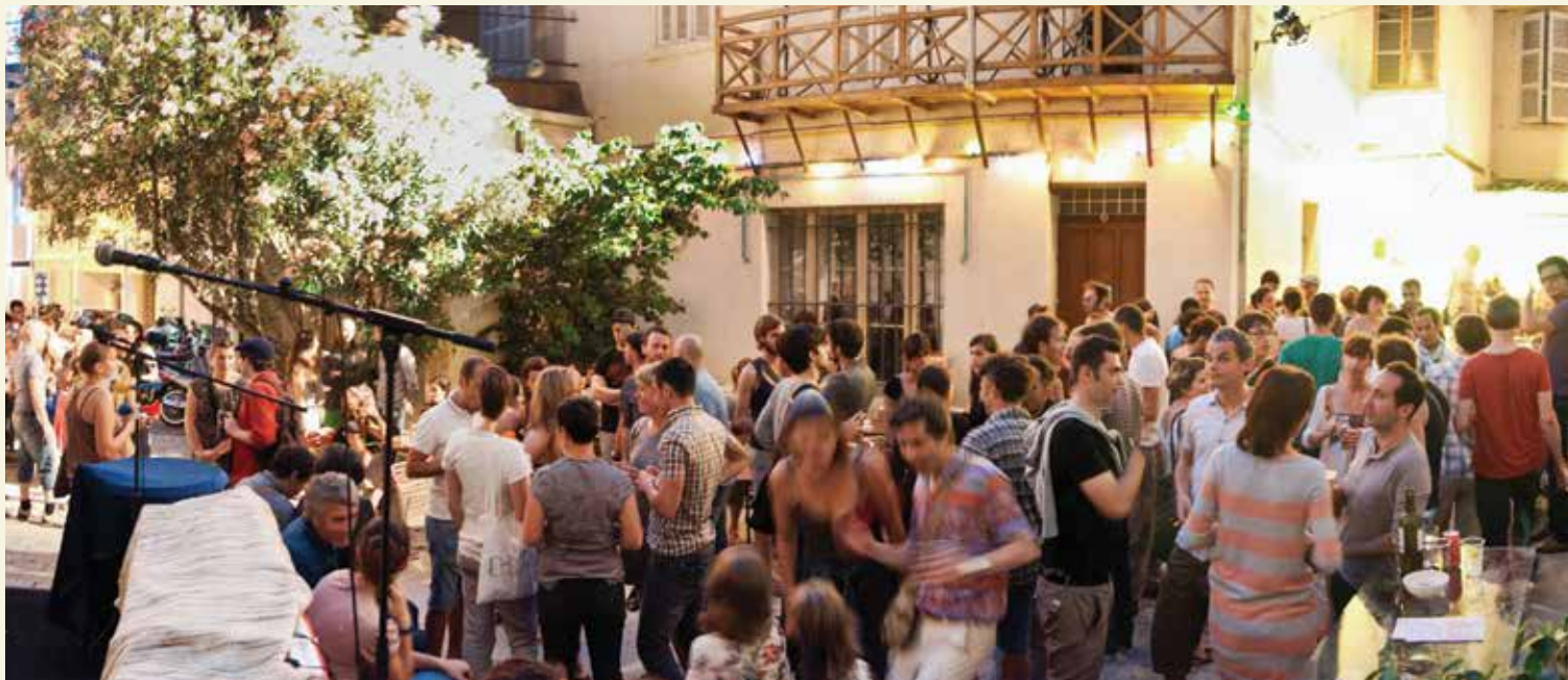
Le centre Montévidéo à Marseille, lieu d'artistes où est établi le festival Actoral.