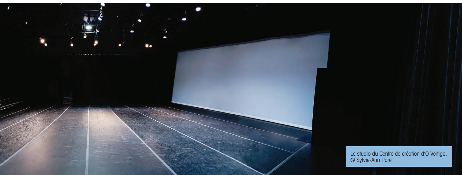
Le studio du Centre de création d'O Vertigo.

expertise administrative éprouvée et dans des conditions financières confortables, un artiste pourrait effectuer un cycle complet de recherche, de création et de production pour un spectacle d'envergure, une « grande forme », avec plusieurs danseurs 1 . Nous avons pensé un lieu où des conditions idéales seraient réunies... Car, depuis trop longtemps déjà, leur effritement a provoqué une perte d'expertise sur le plan local et une perte de reconnaissance à l'échelle internationale.