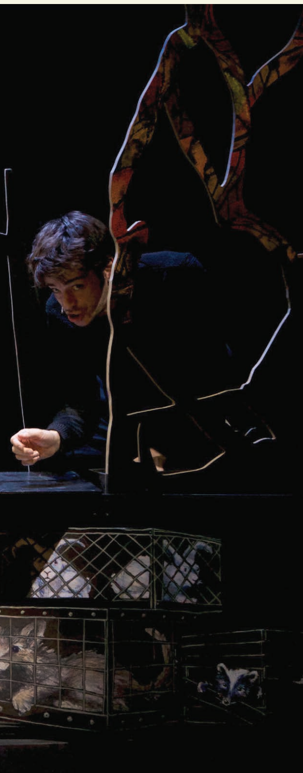
Le Coeur en hiver d'Étienne Lepage, mis en scène par Catherine Vidal (Théâtre de l'Œil, 2015).

Cela ne concerne pas le spectateur; c'est un débat interne qui agite un milieu sclérosé comme toutes les formes d'art le sont, mais qui se trouve dans une dynamique de séduction. Et puis, n'est-ce pas naturel de se ranger dans un groupe, si profondément humain? Être vraiment libre, c'est difficile. Travailler sans balises... On les crée parce qu'on a peur. Et puis, on veut plaire... On ne peut pas créer en ne voulant plaire à personne. En tant que metteur en scène, la tentation est grande de faire des gestes pour démontrer une certaine intelligence. Parfois, ce que je vois sur scène, c'est ça: regardez comme j'ai tellement d'idées, comme je suis brillant! Savoir regarder l'objet, surtout dans ce travail où on a l'impression d'avoir le nez collé sur la vitre, savoir prendre de la distance, ça aussi, ça demande du temps... »