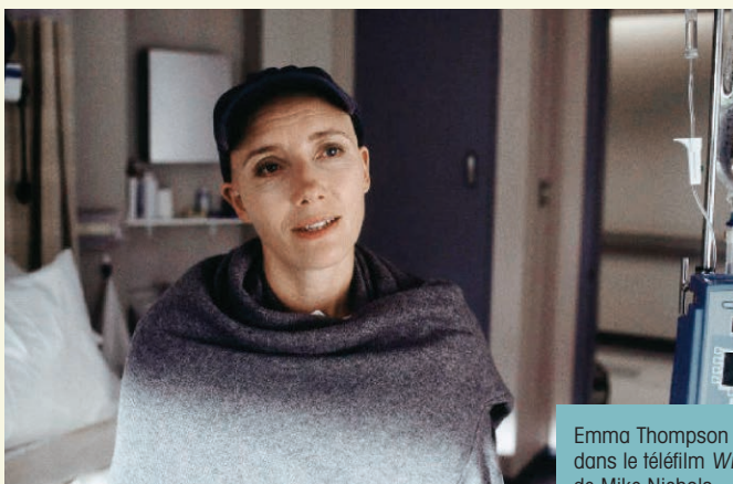
Emma Thompson dans le téléfilm Wit de Mike Nichols (2001), adaptation de la pièce de Margaret Edson.