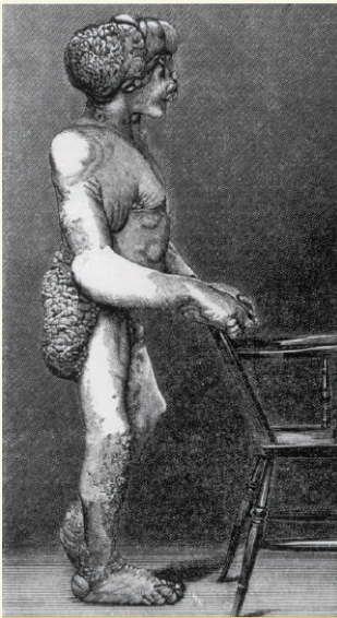
Joseph Merrick, l'homme éléphant, Grande-Bretagne, 1887. © Zoos humains. L'Invention du Sauvage , Paris/Arles, Musée du Quai Branly/Actes Sud, 2011, p. 97.

« Dans l'état de dégénérescence où nous sommes c'est par la peau qu'on fera rentrer la métaphysique dans les esprits. »