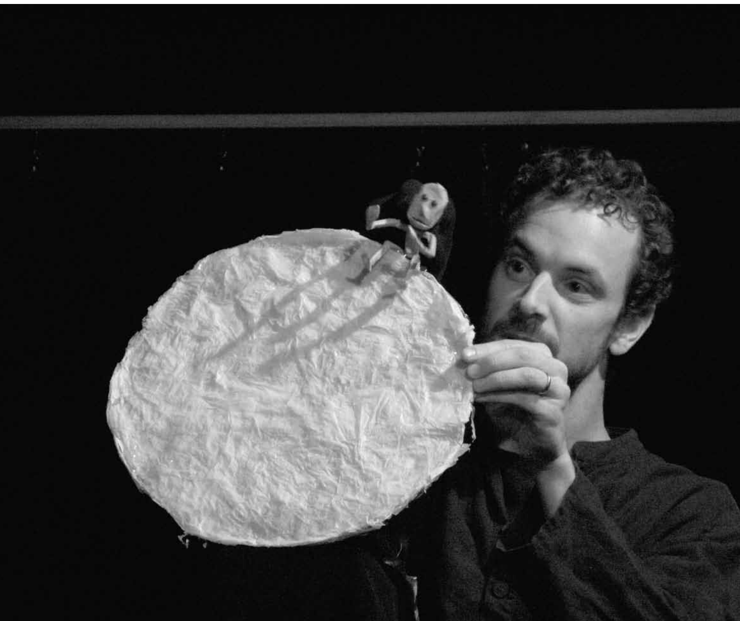
Atelier de mise en scène d'Irina Niculescu.