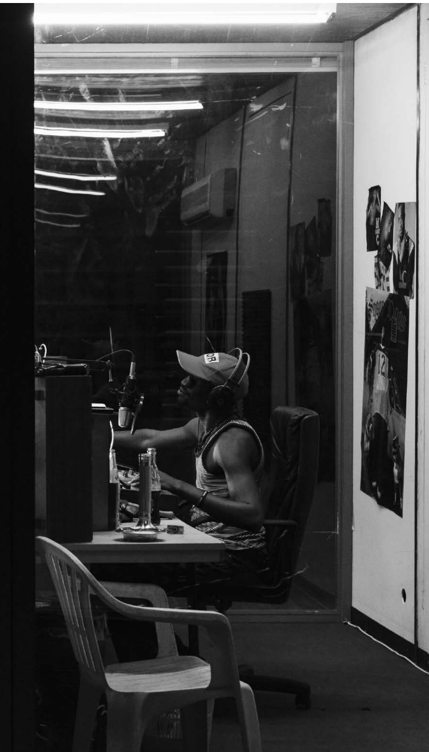
Hate Radio de Milo Rau, présenté au Festival d'Avignon 2013.