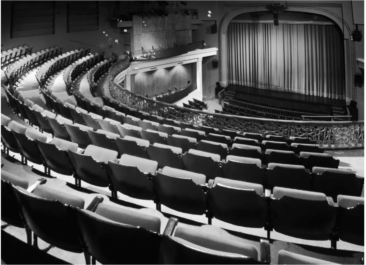
La salle Ludger-Duvernay du Monument-National.

donne son épaisseur, sa substance. C'est pourquoi je n'imagine pas qu'on puisse être un artiste sérieux aujourd'hui si on ne porte pas en soi un certain seuil de conscience historique.