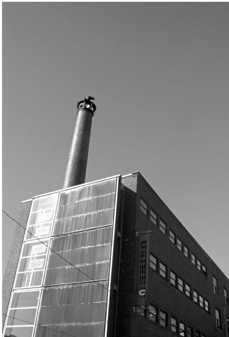
L'Usine C, ancienne usine des confitures Raymond, rue Lalonde.