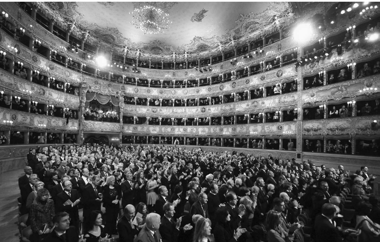
La Fenice à Venise.

d'en dessiner la reconstruction dans l'esprit de la restitution à l'identique avant de mourir en 1997. Huit ans de travaux et soixante millions d'euros plus tard, la Fenice rouvrait là où elle était et telle qu'elle était initialement (seule « correction » : la couleur des murs des loges – d'un beau bleu clair plutôt que du quelconque jaune-beige originel, déjà décrié au XVIII e siècle).