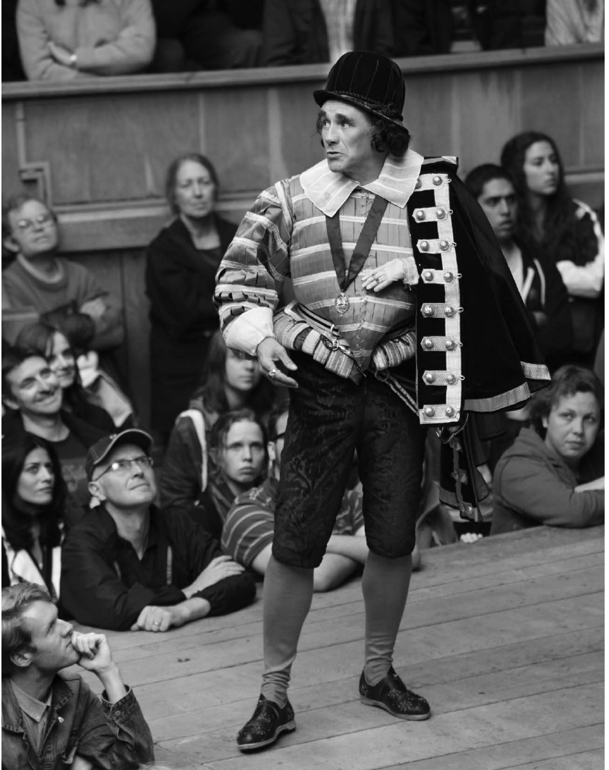
Richard III de Shakespeare, présenté au Globe en septembre 2012.