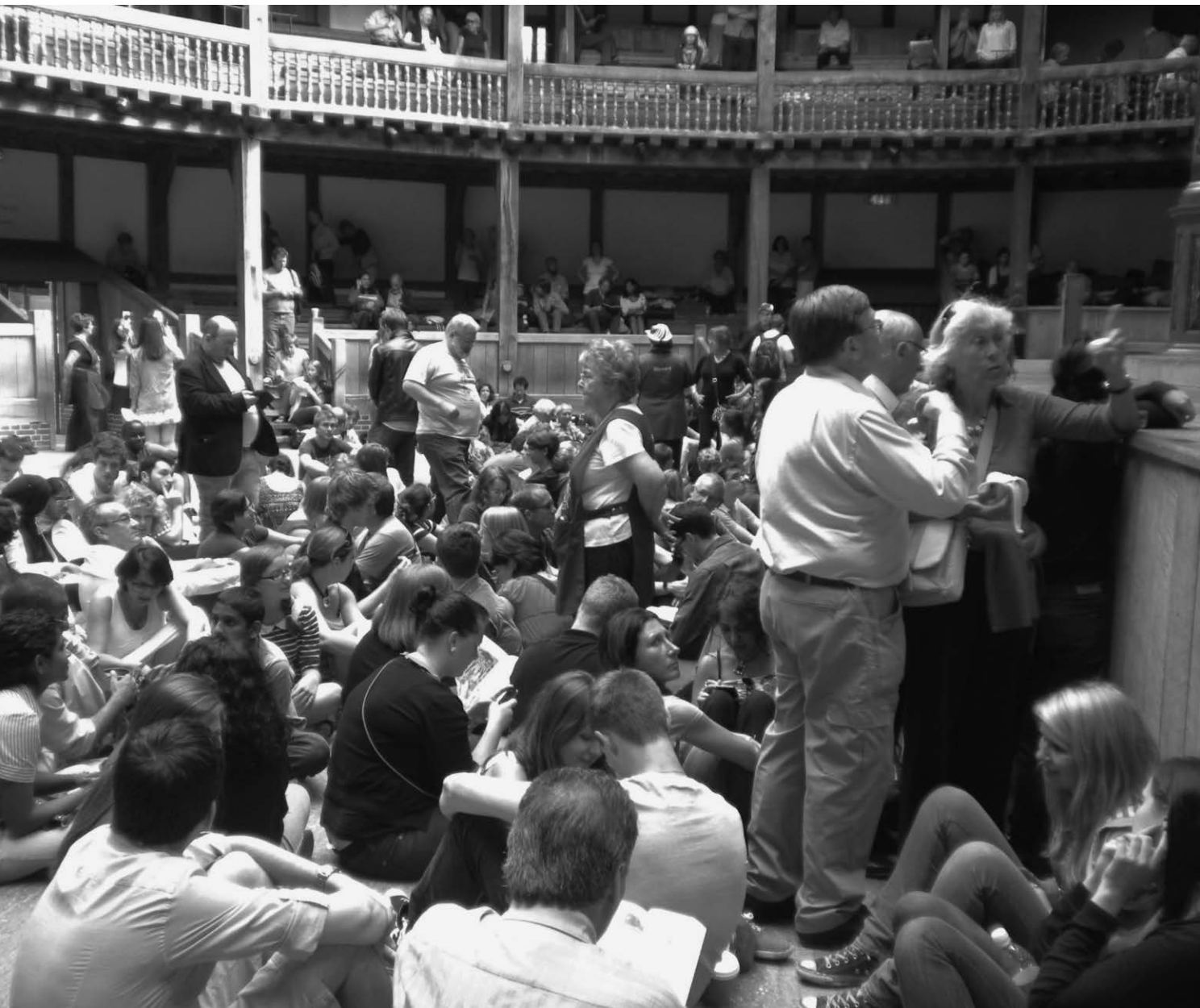
Le public réuni au Globe pour une représentation de As You Like It de Shakespeare en septembre 2012.