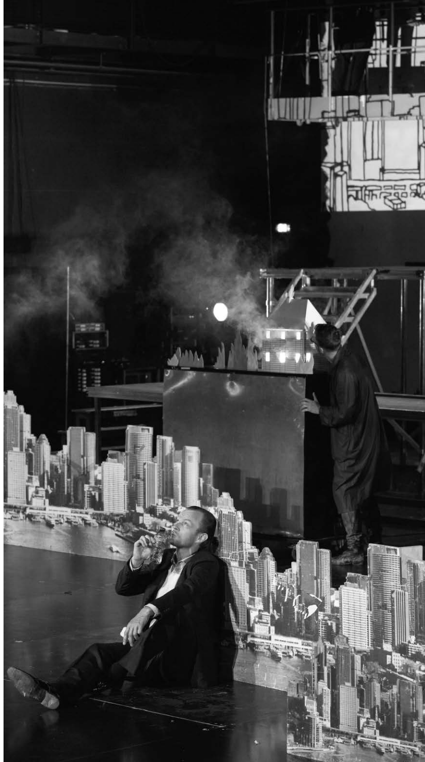
Faust I et II de Goethe, mis en scène par Nicolas Stemann et présenté au Festival d'Avignon 2013.

Comme La vie est un songe , Dom Juan , Peer Gynt , le Songe et le Soulier de satin , Faust est peut-être avant tout un poème dramatique imprégné par un affect d'irréconciliation et une texture de songe. Mais si, au temps de Goethe, Faust était un empêchement par l'inimaginable, il devient aujourd'hui une permission d'imaginer. Stemann et son équipe ne s'en sont pas privés. La force de leur proposition est de nous révéler combien le théâtre est, autant dans son dépouillement que dans ses excès, un art fragile et vulnérable. ■