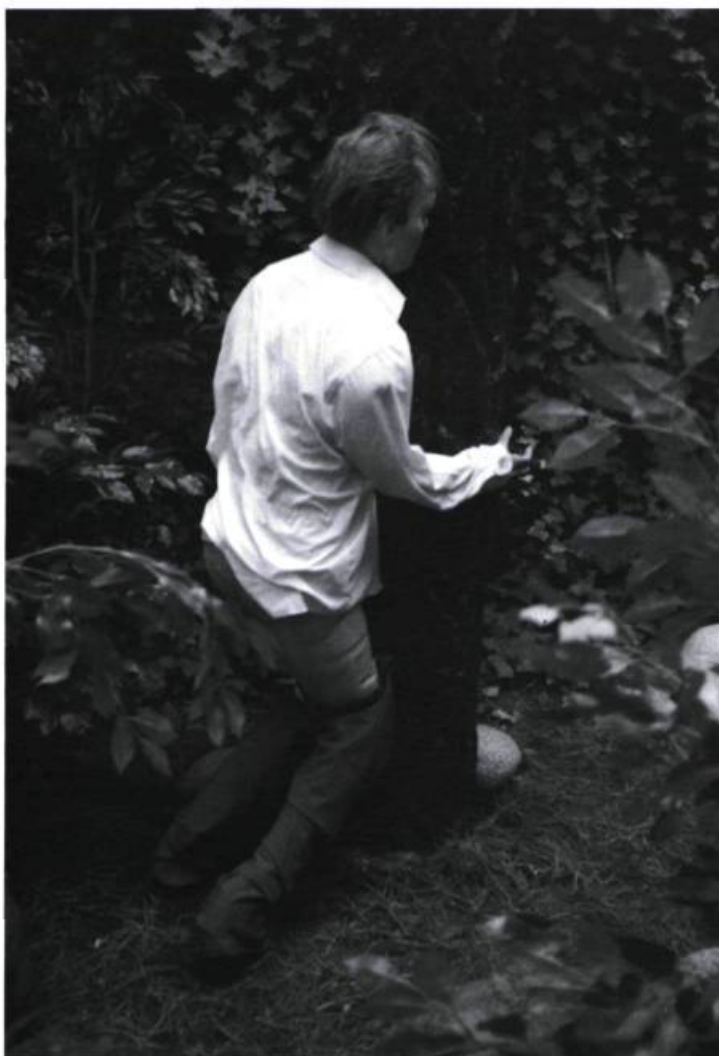
The Garden, Paul McCARTHY, 1991-1992, Coll : Jeffrey Deitch, New York.

Cette courte biographie est tirée de Poésure et peinture , Marseille, 1994.