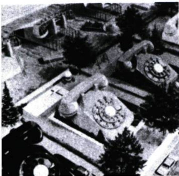
Illustration : Anonyme, On site on energy , 5/6, New York, 1974, p. 61.

⇓ Dans une proportion de 98 %, depuis plus de vingt-cinq ans, les populations d'Amérique du Nord possèdent dans leur maison : la TV, la radio, un réfrigérateur, un poêle, l'eau courante, l'électricité et le téléphone qui demeure encore le seul massmédia interactif.