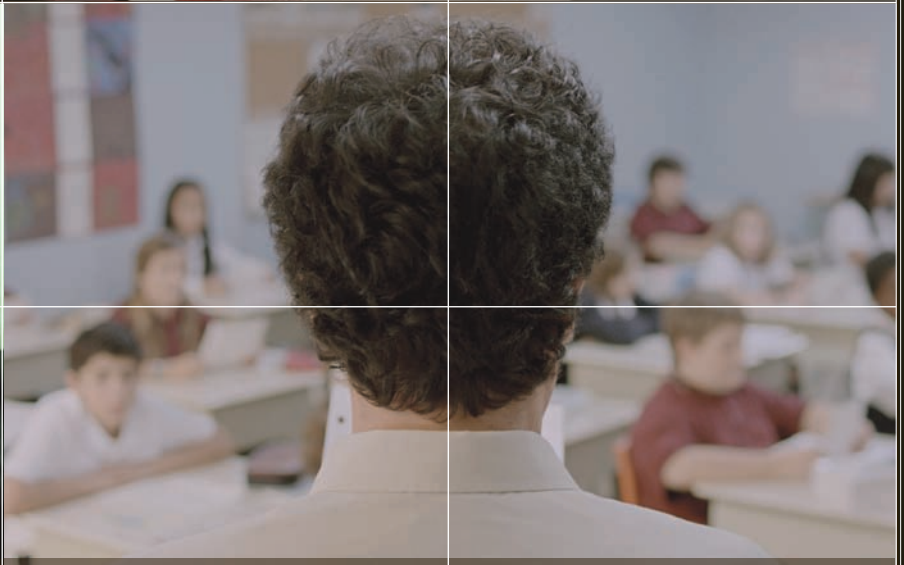
Monsieur Lazhar | Philippe Falardeau p. 58