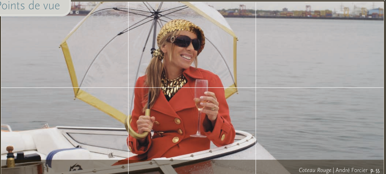
Coteau Rouge | André Forcier p. 55