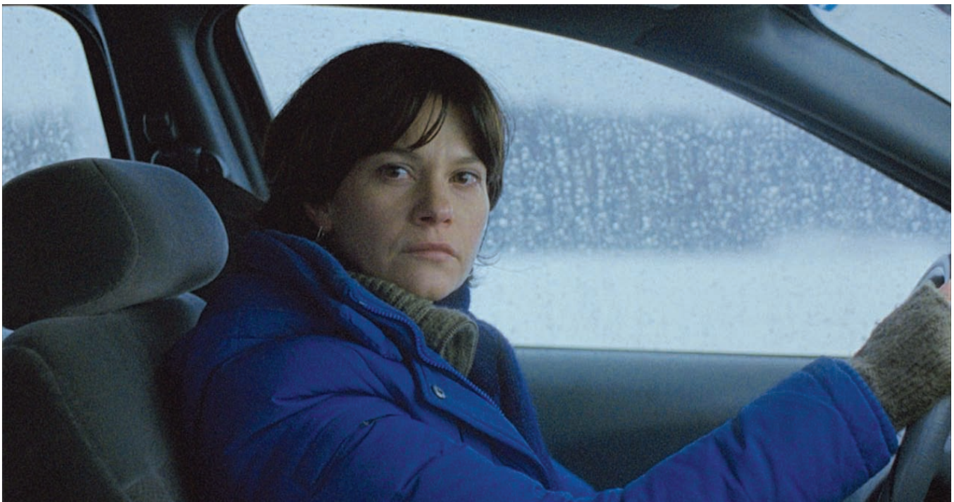
En terrains connus (2011) de Stéphane Lafleur

Sébastien Pilote : C'est une question qui, personnellement, m'angoisse assez ( rires ). Parfois je me demande si je ne serais pas dans la position de continuer la tradition de l'opéra, d'un art en danger de mort. Les films sont des œuvres actuelles, bien sûr, mais il m'arrive de me voir comme si j'étais à l'Opéra de Pékin en train de monter des classiques.