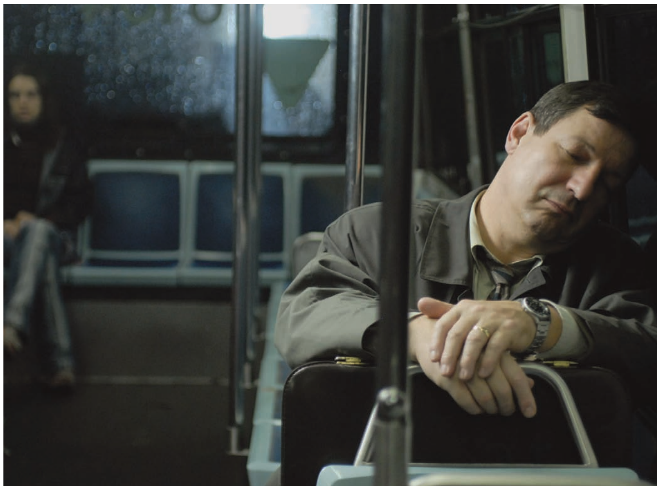
Continental, un film sans fusil

S.P. : Cassavetes a dit quelque chose que j'aime bien : que la plupart des gens croient que l'on va au cinéma pour s'évader, alors que c'est le contraire : on va au cinéma pour se sentir exister. J'aime également beaucoup la comparaison avec la poésie. Souvent, je dis à la blague : si jamais je ne peux plus faire de films, je vais écrire des poèmes et aller travailler à l'usine, ce qui serait un peu comme faire du cinéma ( rires ). ■