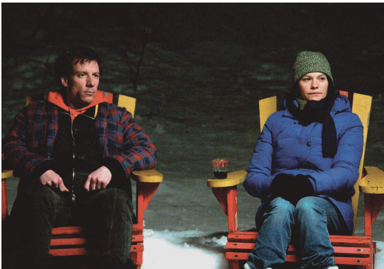
En terrains connus

Mont-Royal. Je crois qu'il est essentiel qu'on s'ouvre à ce qu'est le Québec de 2011 ; Montréal en fait partie, mais il n'y a pas que cela.