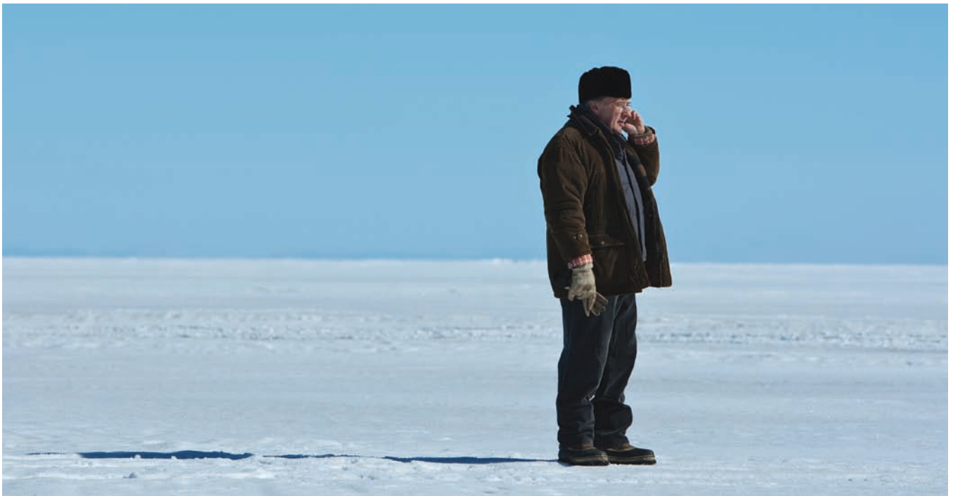
Le vendeur (2011) de Sébastien Pilote

S.L. : D'ailleurs, depuis que les séries télé sont « cinématographiques », on n'en a jamais autant entendu parler. Et ce que proposent ces séries, c'est justement la possibilité de s'attacher à des personnages sur de très longues durées. Elles racontent des histoires souvent classiques ; c'est la preuve, il me semble, que les gens ont encore besoin de fiction et que le cinéma a tout à fait sa place, encore en