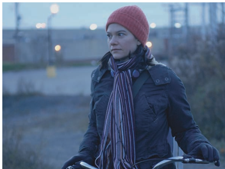
Continental, un film sans fusil (2007) de Stéphane Lafleur