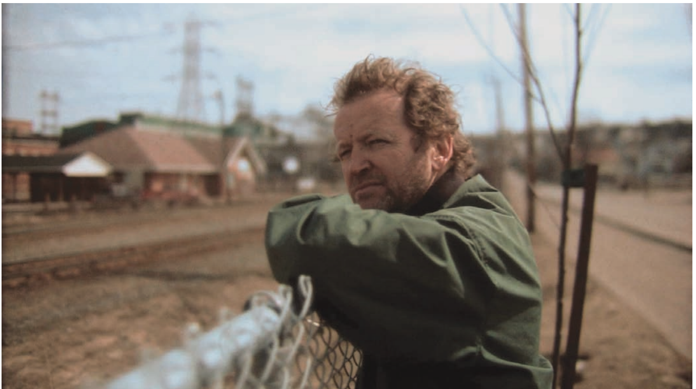
Dust Bowl Ha! Ha!

S.P. : Ce qui est contraignant pour nous, par ailleurs, c'est qu'on sait qu'on ne disposera probablement jamais de plus de deux ou trois millions pour faire un film. C'est bien beau, les chambres d'hôtel et les huis clos à deux personnages, mais ça pourrait être bon aussi de sortir de ce cadre obligatoire. Je crois qu'il faut en tenir compte quand on est en compétition, par exemple dans les festivals, avec des productions qui ont coûté 10, 20 et peut-être 30 fois plus cher. J'entendais l'autre jour à la radio un journaliste de Radio-Canada dire qu'Untel était revenu « bredouille » d'un festival en Californie ! La liberté de création et l'imagination ont aussi un prix. Mais c'est comme ça au Québec : c'est la série B qui reçoit l'argent, les gros budgets, et la série A doit se débrouiller.