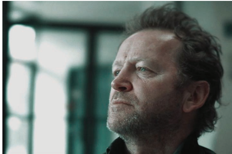
Dust Bowl Ha! Ha! (2007) de Sébastien Pilote

S.P. : Tu vois, moi, ce que je ferais pour le film de Stéphane ( En terrains connus ), c'est de lui donner un budget de diffusion convenable.