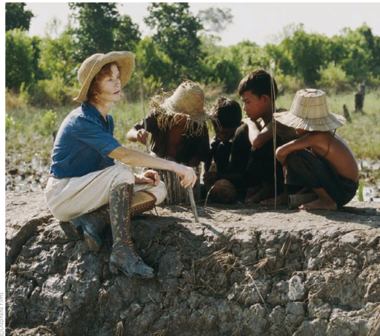
Un barrage contre le Pacifique (2007)

En 2003, vous présentiez S21, la machine de mort khmère rouge qui constitue le noyau dur de votre œuvre. Face à la folie meurtrière que votre pays a connue, vous avez voulu faire œuvre de transmission, construire une mémoire, un regard, une pensée. Comment s'est fait le travail en amont de ce film essentiel et hors normes ?