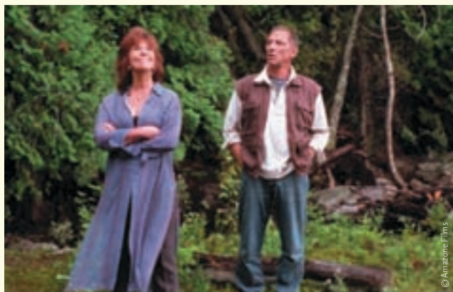
Au fil de l'eau (2003)

En rêvant à l'ONF de l'avenir, il me revient tout de suite un souvenir d'enfance : j'ai 11 ans, c'est samedi matin et ma maman nous annonce toute joyeuse que le lendemain soir, il y aura un nouveau film de Pierre Perrault à la télévision. Je me rappelle un peu les plans des pêcheurs en noir et blanc et beaucoup l'enthousiasme et la fierté de ma mère devant ces images.