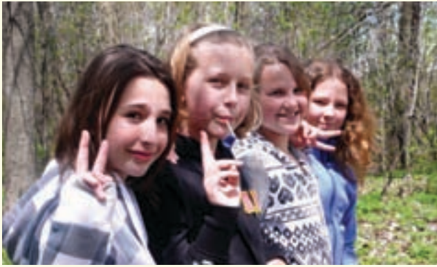
Les porteurs d'espoir (2010)

En déployant beaucoup d'efforts pour investir le Web et développer le e-cinéma , l'ONF me semble prendre une direction d'avenir. Il est certain que la distribution des produits audiovisuels va connaître de grands bouleversements au cours des