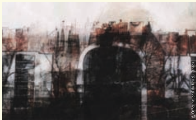
Rosa Rosa (2008)

D'abord, l'essentiel. Un financement suffisant pour soutenir les pratiques artistiques minoritaires et précieuses que sont l'animation, le documentaire et le cinéma expérimental. Pour maintenir des standards de qualité élevés, une rémunération et des contextes de production adéquats pour les artistes. La légitimité publique de l'ONF est liée à la visibilité des œuvres qu'il produit et à l'expression d'un contenu national; sa légitimité intellectuelle et artistique repose sur l'excellence des films qui y voient le jour, sur la rigueur de leur propos et l'inventivité de leur forme.