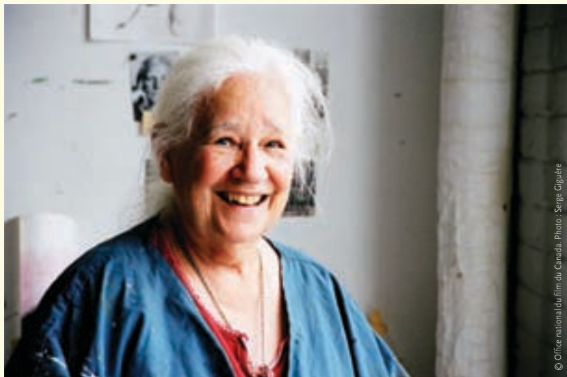
À force de rêves (2006)

Avez-vous vu deux cinéastes passionnés et tonitruants prendre un café à la cafétéria de l'ONF dernièrement? Après 40 ans de fréquentation de ce lieu, moi, je n'en vois plus. Il y a là un fade out alarmant.