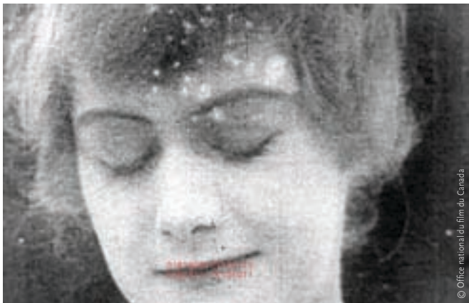
Le fantôme de l'opératrice (2004)

Le «cinéma national» que construit l'ONF fait partie de nos vies de citoyens, de créateurs, de Québécois et de Canadiens de manière unique et intime depuis des décennies. C'est la découverte, au sortir de l'adolescence, des films de l'ONF, mais aussi la fréquentation de la réflexion de ses cinéastes par le biais de revues comme 24 images , qui ont fait naître en moi un sentiment d'identification et d'attachement à cette institution étonnante, sentiment qui ne m'a jamais quittée.