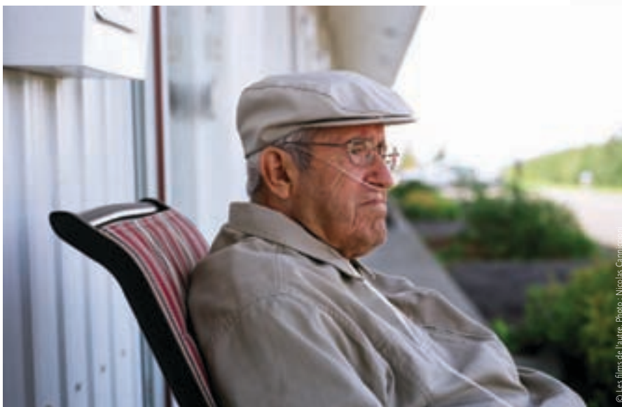
La belle visite (2009)

Également, dans l'optique de positionner l'ONF au centre de cette effervescence que vit actuellement le cinéma québécois, et pour mettre fin à l'attitude passéiste qui tend à glorifier les années d'or de l'institution accompagnée d'une certaine résignation face au