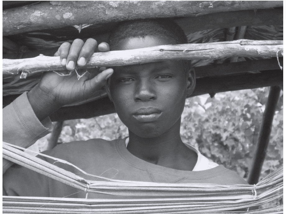
De l'autre côté du pays (2007)

L'idée que l'ONF puisse servir de contrepoids à ce simulacre de dialogue en étant un lieu d'échanges fertiles me séduit. J'aimerais que l'Office soit un immense coin de rue, où jeunes et vieux dis-