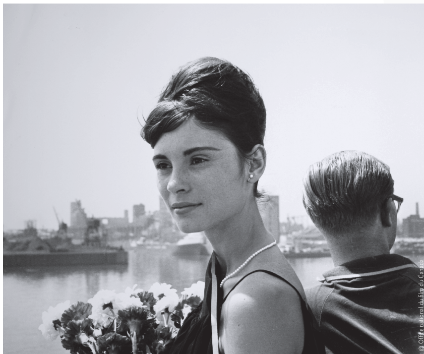
La mémoire des anges (2008)

Que sera ce milieu, cette maison, ce monde de l'image en mouvement dans 20, 30, 40 ans...? Nul ne sait. Je ne le sais pas. Je ne sais pas si l'ONF sera condamné à innover, à prospecter, à chercher encore et toujours... Continuer de justifier son existence et de redéfinir son mandat ou si l'acharnement d'une politique négative à son égard aura eu finalement sa peau?