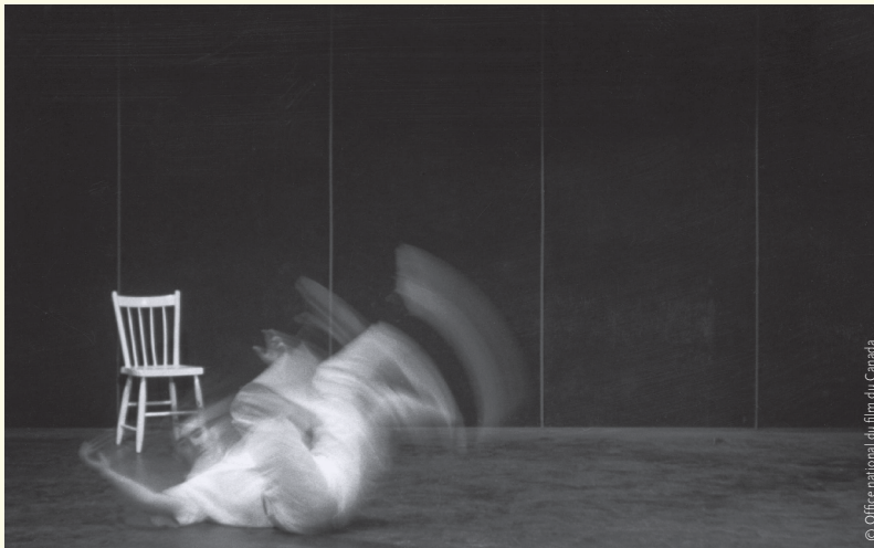
Il était une chaise de Norman McLaren et Claude Jutra

C'est cette volonté de vivre et de créer, cette insatiable soif de connaissance et la capacité de raconter des histoires simples – histoires non officielles que les journaux et la télévision mentionnent très rarement –, comme l'ont déjà fait Michel Brault et Pierre Perrault dans leurs œuvres, c'est ce désir qui m'a poussé à me