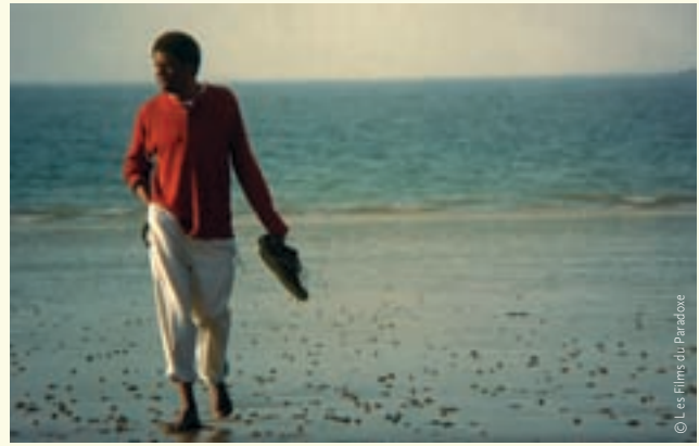
La dérive douce d'un enfant de Petit-Goâve (2009)