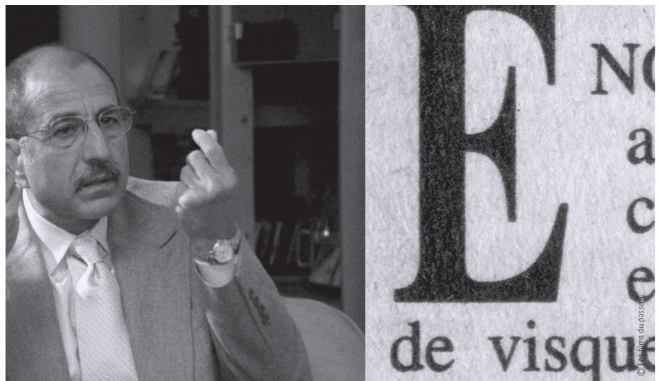
L'encerclement – La démocratie dans les rets du néolibéralisme (2008)

C'est pourquoi je crois qu'il faudrait, par tous les moyens, rendre propice l'éclosion d'une nouvelle collégialité à l'Office. D'abord, on devrait s'assurer d'un minimum de permanence créatrice. Disons que les deux tiers des productions seraient réalisées par des cinéastes maison, engagés par contrats de court et moyen termes (entre trois à sept ans, par exemple), tout en laissant la porte ouverte aux pigistes. Cela dans le but que les cinéastes participent aux décisions en matière de programmation (c.-à-d. ce qu'on produit ou ne produit pas). La formule du «Comité du programme» a fait ses preuves dans les années 1960 et 1970, mais pourquoi ne pas en inventer une nouvelle? L'essentiel, c'est de revenir à une