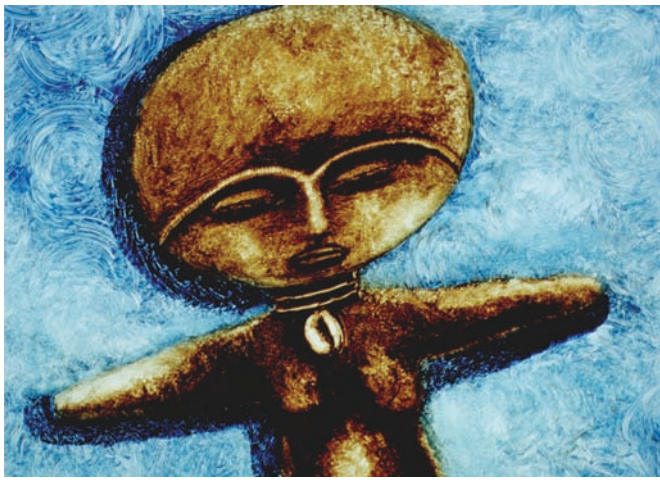
Âme noire (2000) de Martine Chartrand