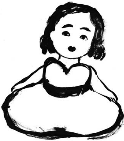
Le chapeau (1999) de Michèle Cournoyer