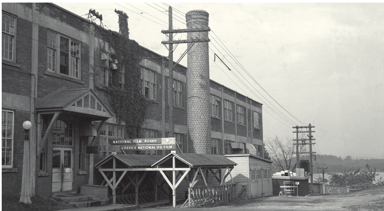
Les quartiers généraux de l'Office national du film au 25, John Street à Ottawa (1947)

AU COURS DE SON HISTOIRE DE PLUS DE 70 ANS, L'ONF S'EST DÉVELOPPÉ AU FIL DES VISIONS successives qui se sont cristallisées dans des films. Il importe, au moment de réfléchir à l'avenir de cette institution, de rappeler celles-ci, pour montrer comment l'identité de l'organisation s'est peu à peu forgée grâce à l'apport créatif et intellectuel de quelques individus. Car lorsque certains déplorent la situation actuelle à l'ONF, c'est autant le manque de moyens chronique qu'ils désignent qu'une certaine crise philosophique. Où sont donc les visionnaires d'aujourd'hui? L'époque est-elle propice à l'expression de ces idées folles et généreuses qui permettent à la création de se régénérer? L'ONF se donne-t-il encore les moyens d'abriter la saine tension entre l'administration et la création, qui permet à l'ensemble de l'organisation de se transcender? Autant de questions auxquelles il n'y a pas de réponses simples. Voyons donc, modestement, ce que l'histoire nous enseigne.