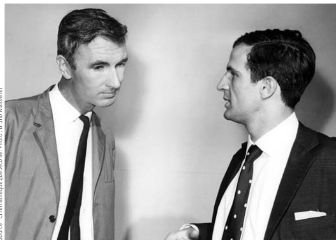
Norman McLaren et François Truffaut au Festival international du film de Montréal de 1961