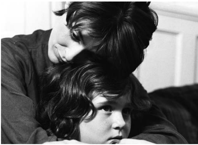
Le temps de l'avant (1975) d'Anne Claire Poirier, de la série Société nouvelle