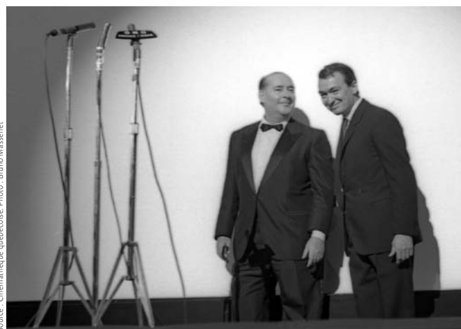
Pierre Juneau et Roberto Rossellini lors du Festival international du film de Montréal en 1965