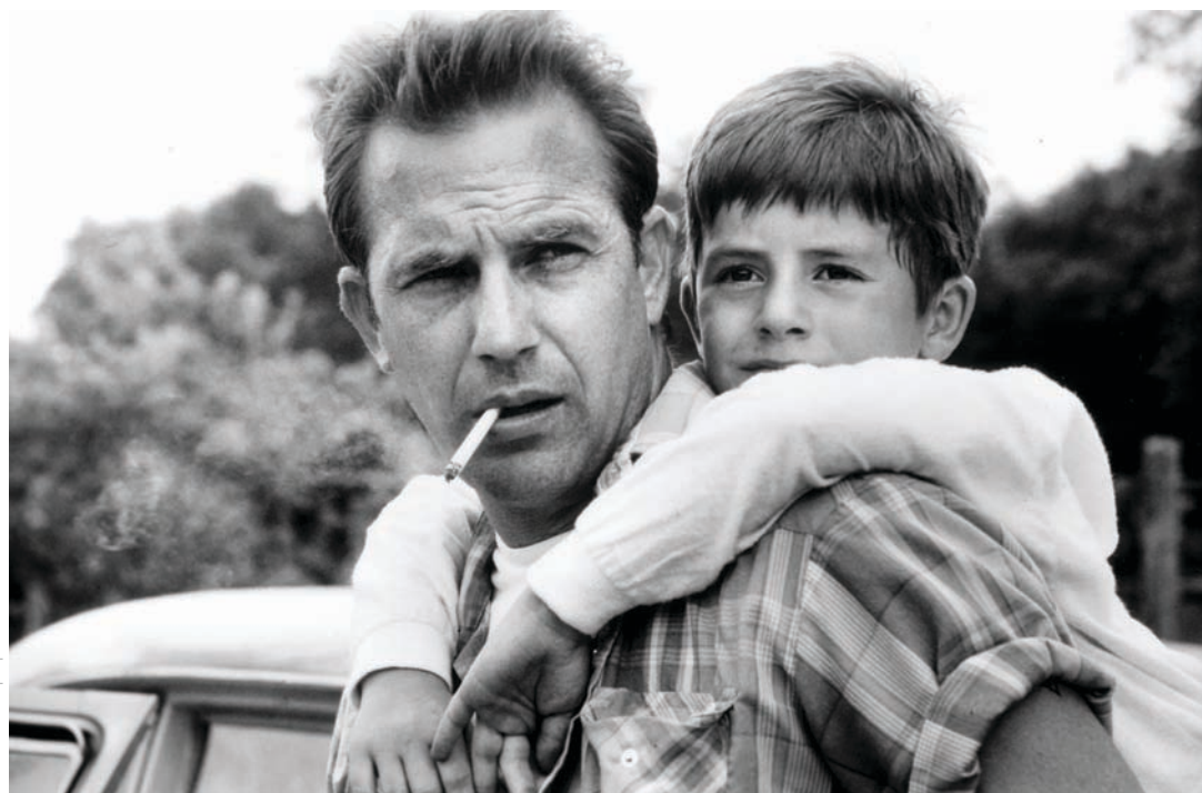
A Perfect World , un de ces films qui laissent affleurer une certaine mélancolie.