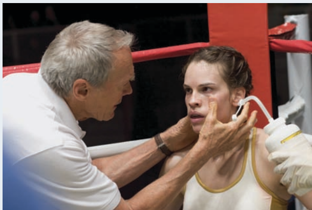
Million Dollar Baby