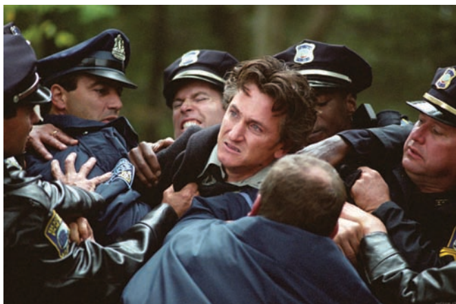
Mystic River (2003) ou le passé qui hante le quotidien

laissant ses personnages subir avec résignation les crocs en jambe du destin. Eastwood radicalise ici cette proposition en suggérant l'idée qu'aucune rédemption n'est réellement possible, l'inexorable déchéance des âmes et des corps ayant déjà débuté. Un sentiment mortifère pèse sur le film et se diffuse d'ailleurs dès le générique d'ouverture, accompagné par la voix envoûtante et chargée de spleen de K.D. Lang, créant une opposition symbolique, par la grâce d'un travelling rapide et élégant, entre la nature luxuriante du Sud et des plans de tombes et de statues en pierre d'un cimetière.