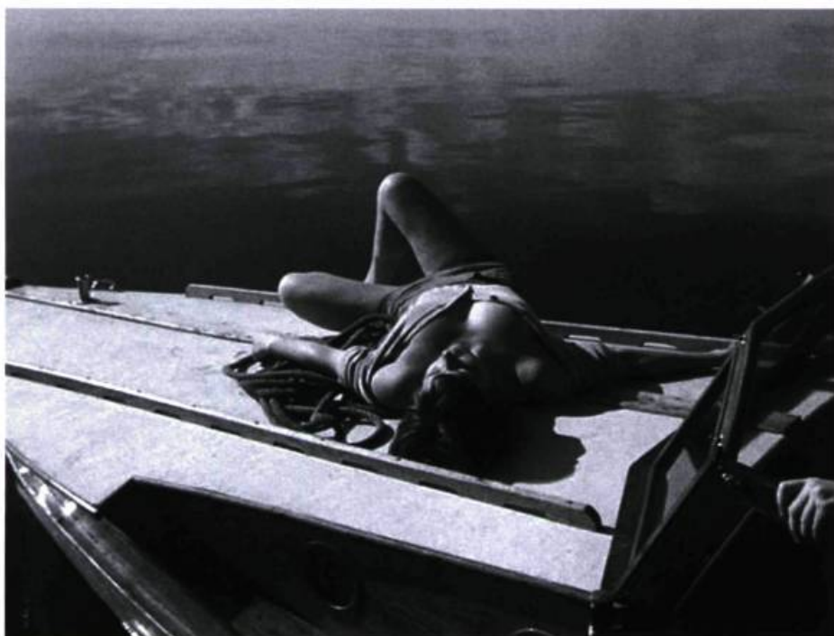
Monika d'Ingmar Bergman

HOMME DE THÉÂTRE HABITUÉ AUX ESPACES CLOS, INGMAR BERGMAN A BEAUCOUP utilisé la nature dans ses œuvres de cinéma. Comme pour la majorité des Suédois, la nature, pour lui, c'est d'abord la mer, et surtout la mer domestiquée de l'archipel de Stockholm.