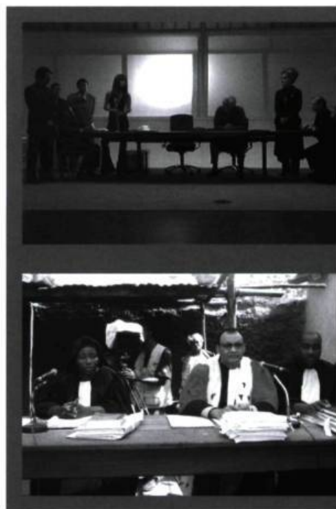
Southland Tales de Richard Kelly et Bamako d'Abderrahmane Sissako.