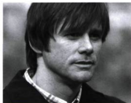
Eternal Sunshine of the Spotless Mind.

C'est l'un des plus épatants acteurs américains de l'heure et le digne successeur des Laurel et Hardy, Marx Brothers et Jerry Lewis du burlesque. Capable de tout : de changer de corps, de visage, de voix, il a un jeu débridé, rageur et inquiétant. Il frôle plus la transgression que la monstruosité. Il fait grimaces sur grimaces sans que la beauté classique de son visage en soit abimée, peut-être parce que nous voyons dans ses yeux une force irréprouvable qui risque de nous happer ainsi que la petite lampe – étrange, dans son cas – de la mélancolie