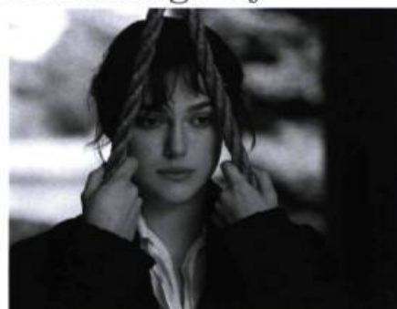
Pride and Prejudice.