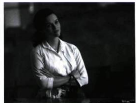
Walk the Line.

Tout a été dit sur sa performance dans Walk the Line . Witherspoon y est exceptionnelle, jouant avec simplicité et candeur un personnage d'une surprenante densité, sans les artifices du maquillage et du déguisement. Devenue star grâce à son rôle dans Legally Blonde , elle avait été révélée en jouant les adolescentes dans Fear de James Foley, Pleasantville de Gary Ross et Election d'Alexander Payne. Des personnages pluridimensionnels, évoluant au fil des récits, de beaux défis pour une jeune actrice. S'apprête à tenir le rôle principal de Bunny Lake Is Missing , remake du classique d'Otto Preminger. On salive déjà ! – M.J.