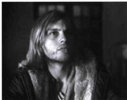
A History of Violence.

Alias Kurt Cobain dans Last Days . À 25 ans, l'écorché vif, l'éternel adolescent rebelle en a fait du chemin depuis la série Dawson Creek . Sa double identité de star du rock et d'acteur en vogue devrait lui permettre un certain temps d'écumer les road movies et les films qui gravitent autour d'une certaine idée de la scène punk. Proche de la galaxie Asia Argento / JT Leroy ( The Heart Is Deceitful Above All Things ),