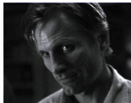
A History of Violence.

Un grand nombre de films oubliés et oubliables, quelques belles apparitions (notamment dans Carlito's Way ), un succès planétaire avec The Lord of the Rings et, à bientôt 50 ans, une interprétation géniale dans A History of Violence , où il donne enfin la pleine mesure de son talent. Sous la direction de Cronenberg, l'intensité de son jeu et sa capacité à s'imprégner de toutes les facettes de son personnage sont stupéfiantes et, disons-le, auraient mérité toutes les récompenses du monde. Au dernier plan, son regard d'homme (et non plus seulement d'acteur) paraît à ce point chargé de toute l'histoire du film qu'il traduit aussi une forme rare et bouleversante d'épuisement. – É.V.