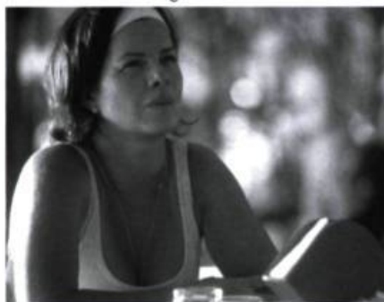
Casa de los Babys.

Appartient à l'écurie des frères Coen, qui lui offrent le rôle de Verna Bernbaum dans Miller's Crossing . On la sent s'amuser follement de l'ambiguïté d'un personnage dangereux, mélange explosif d'énergie sexuelle, de stratégie politique et d'instinct maternel démesuré. Il lui faut dix ans pour voir descendre sur elle la grâce d'un autre grand rôle. C'est celui de Lee Krasner dans Pollock , autre débordement maternel, doublé cette fois d'une vive intelligence et d'une détermination sans faille. Clint Eastwood perçoit en elle la générosité et la tendresse indispensables au personnage de Celeste Boyle dans Mystic River . Trois grands rôles en plus de 20 ans de carrière, c'est assurément trop peu. – M.J.