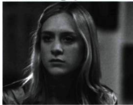
Melinda and Melinda.

La fantasque Chloë Sevigny, transfuge des milieux de la mode, est tout d'abord entrée de plain-pied dans l'univers underground trash d'Harmony Korine ( Kids, Gummo, Julien Donkey-Boy ). Et elle ne s'y est pas perdue, ce qui en soi est tout un exploit ! Sans faire de bruit, elle semble avant tout avoir la tête sur