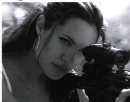
Mr. and Mrs. Smith.

Superhéroïne, extrêmement « physique » (!), elle est la « bad girl » du cinéma américain. À tel point que si elle jouait avec King Kong, on aurait peur pour la pauvre bête. Star à la ville comme à l'écran, réservoir inépuisable pour les journaux à potins comme pour les fantasmes masculins, la très intense et très désinvolte Angelina est la star moderne. Au côté de Nicole Kidman, mais en plus sauvage, elle est Hollywood, dont elle représente avec succès les aspects les plus démesurés, glamour et... ultra-sexués. Pas de bons