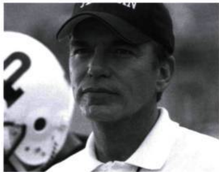
Friday Night Lights.