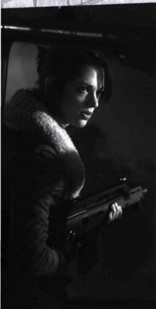
Land of the Dead.