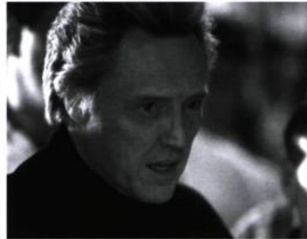
The Stepford Wives.

Acteur de théâtre (Shakespeare, Tchekhov), sa voix toujours le précède. À la télévision ( Kojak , etc.), comme au cinéma (plus de 60 films), c'est son visage anguleux qui immédiatement l'impose. Ce faciès très particulier le prédestinait à incarner les tordus et c'est pour un rôle de tordu que son nom nous est si cher : c'est lui, dans son bel habit de lin fripé, qui hante les nuits de Venise dans le très beau, et combien sous-estimé, The Comfort of Strangers (1990) de Paul Schrader. Rarement a-t-on vu incarnation si convaincante du Mal, la maîtrise par l'acteur du mystérieux dialecte des paumés de la nuit n'étant pas étrangère à la peur qui nous envahit à chacune de ses apparitions. Mais cette présence, on l'avait déjà sentie dans l'attachant Next Stop Greenwich Village , ce que vit bien Michael Cimino qui confia à Walken deux rôles de premier plan (Oscar du meilleur acteur de soutien pour The Deer Hunter , 1978). Plusieurs autres grands rôles suivirent; contentons-nous de rappeler le travail exemplaire de l'acteur dans The Funeral d'Abel Ferrara. – R.D.