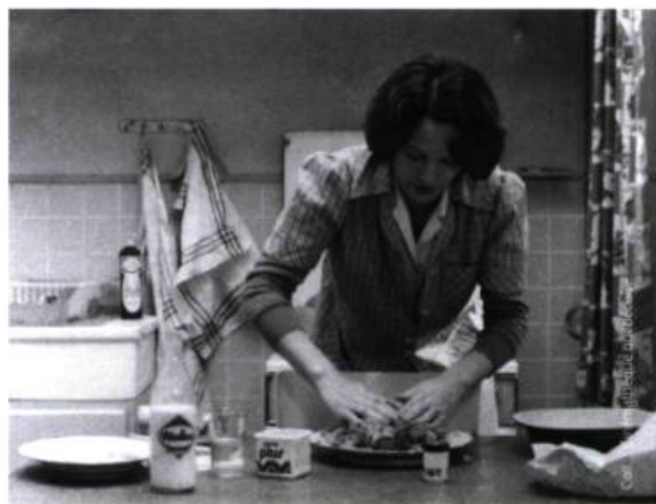
Jeanne Dielman, 23, quai du Commerce, 1080 Bruxelles (1975).

gnent à l'intérieur du cadre, y entrent ou le laissent vide, ou encore semblent y être tout simplement échoués, esseulés et insomniaques. Le talent d'Akerman pour filmer l'entrée des corps dans un plan et leur sortie, pour chorégraphier leur danse et leurs postures, pour filmer l'invisible (ici non pas le temps mais le désir, ce fil qui fait tenir les plans du film ensemble), est illustré ici magistralement. Le féminin y est célébré plus que tenu à distance, il est affaire de robes virevoltantes aux tissus moirés, de ceintures dessinant des tailles de guêpe, il est mise en scène et appât. C'est par le burlesque qui gagne les