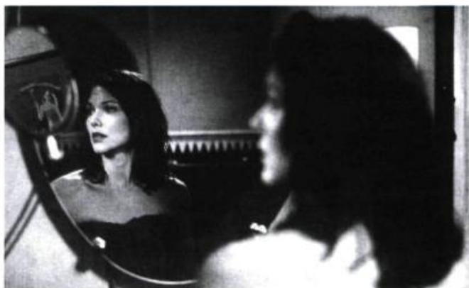
Mulholland Drive (2001).

peut bien investir les genres (la science-fiction, le film noir, le road movie, le policier), multiplier les figures appartenant à l'histoire du cinéma, accompagner ces images de musiques qui sont des rappels d'une autre époque, rien dans ce cinéma n'emprunte la ligne citationnelle, et si le style parfois peut rappeler un certain maniérisme, jamais il n'apparaît maniéré .