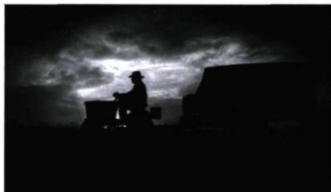
The Straight Story (1999).

L ynch a réussi l'exploit d'insuffler un rare degré d'abstraction au cinéma américain mainstream et d'élever de la sorte à des hauteurs insoupçonnées la puissance réflexive de l'image cinématographique, au risque de s'aliéner une part importante du public traditionnel, effrayé par la dimension expérimentale d'une œuvre sans concession, plus proche par certains aspects des tendances de l'art contemporain que de la production commerciale. Car s'ils donnent beaucoup à voir, les films de Lynch offrent peu de réponses aux questions qu'ils ne manquent jamais de soulever, ouvrant une brèche dans la rationalité du récit classique, drapant d'une voile de mystère la supposée transparence des représentations. Cela explique probablement pourquoi peu de corpus de cinéma ont suscité une exégèse aussi abondante, et provoqué dans la même foulée autant d'incompréhension. Fidèle à l'esprit d'une œuvre qui va en s'opacifiant à mesure qu'elle croît et gagne en maturité, Lynch a toujours refusé d'en fournir la clé, laissant entendre que ses films se suffisent à eux-mêmes et contiennent leurs propres explications.