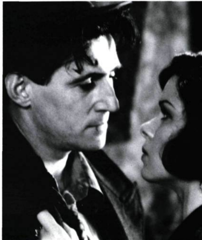
Gabriel Byrne et Marcia Gay Harden, Miller's Crossing

Il s'exerce doublement même, puisque cet éclairage s'y fait outrageusement artificiel et que l'on peut y voir, du coup, un pastiche de cette fichue post-modernité (dont on fait régulièrement le post-mortem), à travers l'utilisation grand-guignolesque que font les frères Coen de certains de ses éléments : le recyclage (le retour au «genre» se fait ici sur le mode de la dérision), le métissage et le simulacre (la typologie des personnages qui nous renvoie à la bande dessinée, la pose et le jeu affectés des acteurs qui nous convoquent à des mises