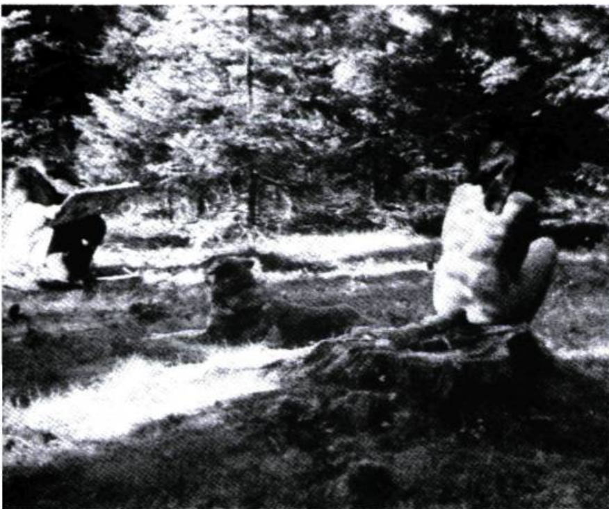
La femme au paysage