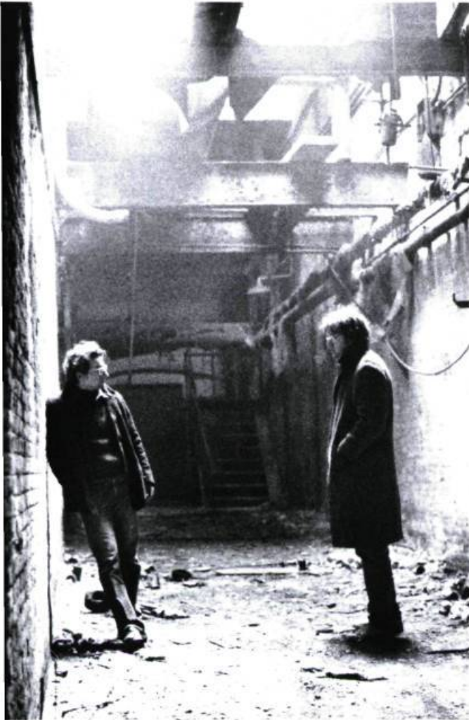
Matt Craven et Tim Robbins, Jacob's Ladder

Dans Flatliners , succès de l'été dernier, cinq apprentis sorciers faisaient joujou avec la mort clinique pour aller voir à quoi ressemblait la vie après la vie. Filmée par Joel Schumacher, elle ressemblait à un clip, mais passons: c'était bien assez pour