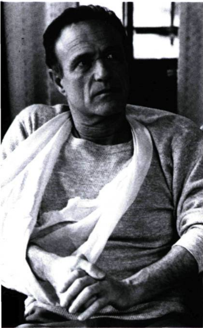
James Caan, Misery