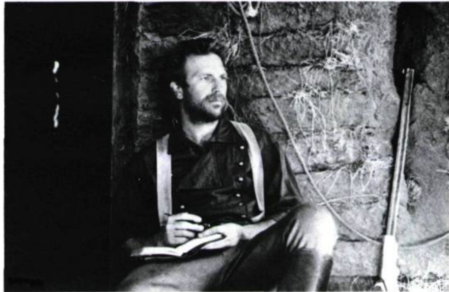
Kevin Costner, Dances with Wolves