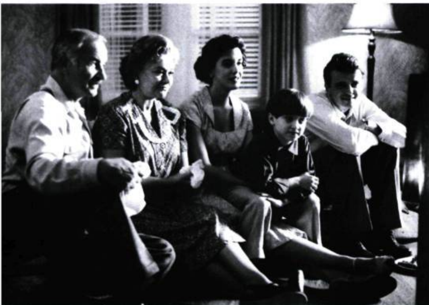
Armin Mueller-Stahl, Joan Plowright, Elisabeth Perkins, Elijah Wood et Aidan Quinn, Avalon