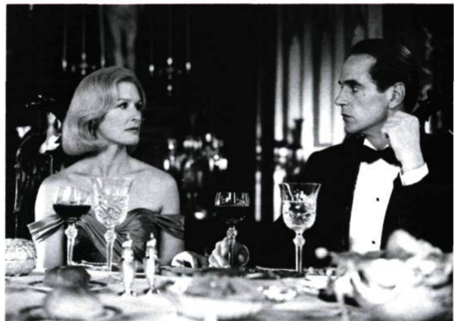
Glenn Close et Jeremy Irons, Reversal of Fortune

Les films sur la justice et les procès forment presque un genre dans le cinéma américain; on pense immédiatement à l'un de ses plus célèbres, Twelve Angry Men de Lumet. L'idée d'une justice équitable qu'ils transmettaient relayait une conception éminemment glorieuse d'une Amérique juste pour tous. Tout citoyen était égal devant les juges: le petit pouvait vaincre le gros, le pauvre gagner sur le riche. Mais pour Barbet Schroeder, un Européen, la justice devient une machine qui roule bien, mais pour elle-même et les millionnaires. Un aristocrate, Claus von Bülow, est accusé de tentative de meurtre sur sa richissime femme, Sunny. C'est par ce protagoniste d'un cynisme élégant et d'une tranquillité macabre (Jeremy Irons), et non par celui de Sunny (Glenn Close), qui est pourtant la narratrice, que le cinéaste projette une image plutôt cruelle d'une Amérique qui aurait perdu, en même temps que le sens de la justice, son énergie. Rarement film venu des U.S.A. nous aura communiqué l'impression d'une Amérique si physiquement immobile, moribonde, aussi comateuse que Sunny von Bülow. Un univers hors-temps, «déchronologisé» par ses flashes-back (Schroeder se permet même un flash-back dans un