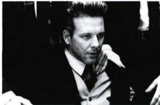
Mickey Rourke, Desperate Hours