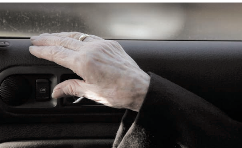
LE MÉTÉORE de François Delisle, sorti simultanément en salle et en VOD.