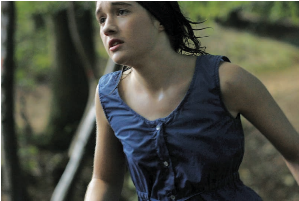
HADEWIJCH. Bruno Dumont, cinéaste de festival? Et pourquoi pas?

œuvres de tous types n'est plus limité par la volonté de quelques programmeurs (télés, festivals, salles, etc.) démiurges et surtout par l'impitoyable juge qu'est le box-office. Ou alors parlons du véritable box-office, celui qui devrait être mesuré sur l'ensemble de ces plateformes, qui devrait comptabiliser des individus et non des dollars et surtout, surtout, qui devrait être mesuré sur une période beaucoup plus longue! À moins de considérer qu'un film est périssable tel un mouchoir jetable, il n'y a aucune raison de ne pas tenir compte de sa destinée face à l'histoire. Après tout, ne dit-on pas que le Snow White de Disney ne fut « rentable » qu'après près d'un demi-siècle d'exploitation?