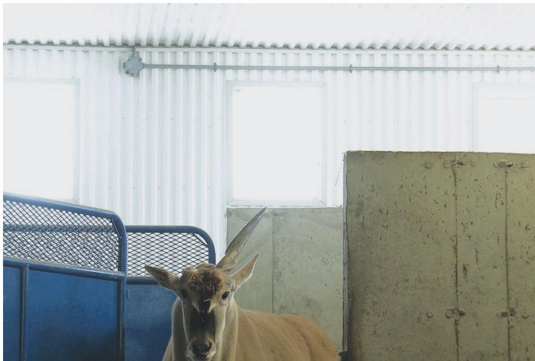
BESTIAIRE de Denis Côté. Moins de 500 spectateurs lors de sa sortie à Montréal, alors que le film circule partout sur la planète.

LE CINÉMA A 100 ANS ET DES POUSSIÈRES... JEUNE ET VIEUX À LA FOIS. LA SALLE DE CINÉMA, OBJET DE TOUS LES désirs et de tous les fantasmes, n'a cessé de se transformer, tant dans son architecture que dans ses objectifs. Rien de nouveau jusque-là. L'arrivée de la télévision puis de la vidéo domestique a chaque fois ébranlé le temple. Il est encore debout, son nouvel avatar s'appelle multiplexe et il se veut de plus en plus immersif. En Amérique du Nord, il présente des taux d'occupation d'environ 10%. Qu'à cela ne tienne, le véritable but affiché par ces temples du divertissement n'est pas de servir le cinéma mais de se servir du cinéma pour favoriser leur achalandage et la consommation. Surtout la consommation, une consommation de masse qui répond aux lois de l'offre et de la demande. Du pain et des jeux à l'ère de la société du spectacle.