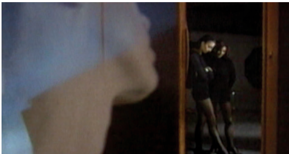
↑ → → → Harems (1991)