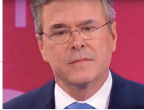
↑ Trump Has No Chill at the 9th GOP Debate