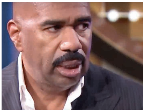
↑ Steve Harvey Will Be Hosting Family Feud Forever et Steve Harvey Meets his Replacement