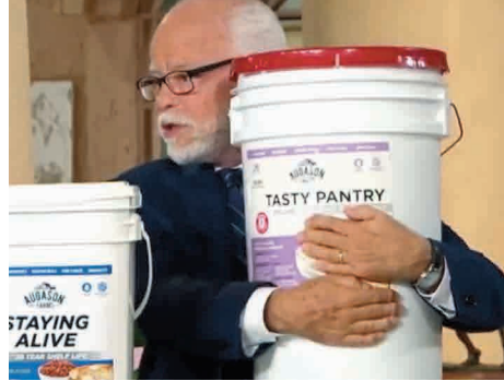
↑ Pastor Jim Bakker Helps You Stay Alive During the Apocalypse