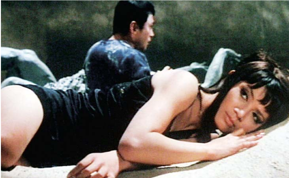
↑ Moju: the Blind Beast de Masaru Konuma (1969)