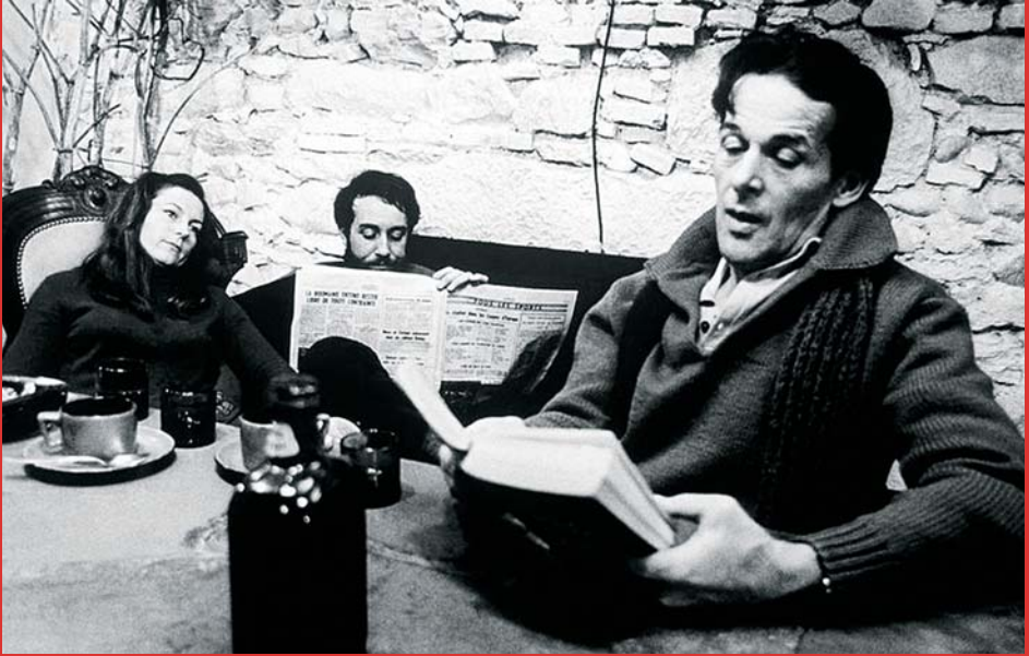
↑ Charles mort ou vif de Alain Tanner (1970)