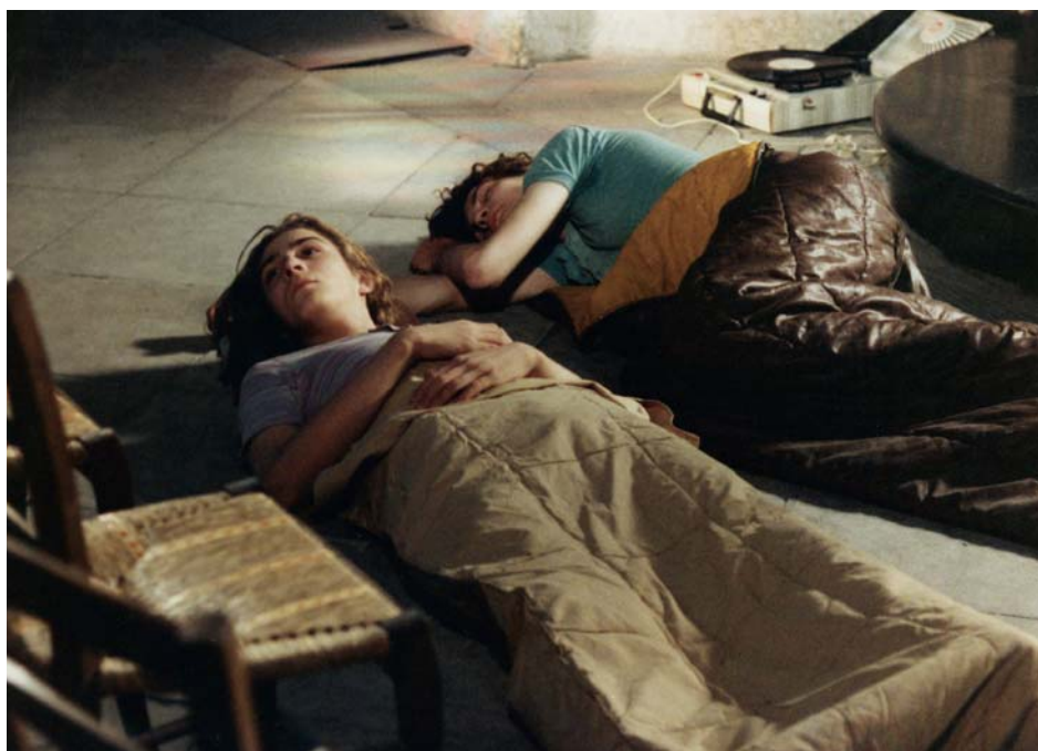
↑ Le diable probablement de Robert Bresson (1977) → Portrait d'une jeune fille de la fin des années 60 à Bruxelles de Chantal Akerman (1994)