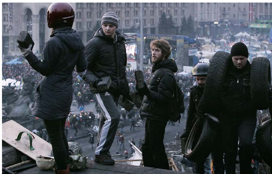
↑ Maidan de Sergei Loznitsa (2014) → 24 heures ou plus de Gilles Groulx (1977)