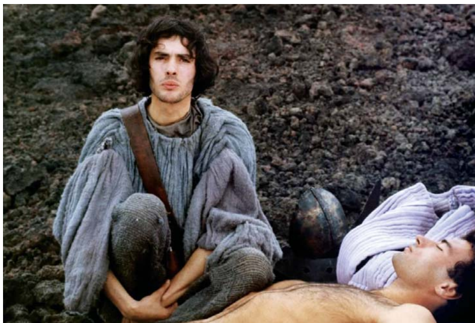
↑ Porcherie de Pier Paolo Pasolini (1969) → Ice de Robert Kramer (1969)