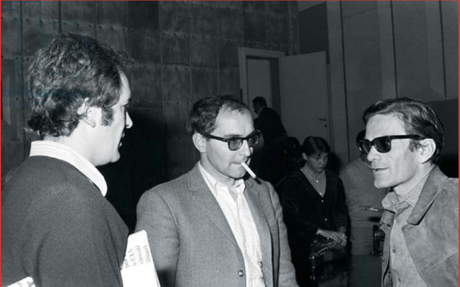
↑ Bernardo Bertolucci, Jean-Luc Godard et Pier Paolo Pasolini, présentation du film collectif Amore e rabbia (1969)

Comme dans un film de Godard : seul dans une voiture qui roule sur les autoroutes du Néocapitalisme latin. Pier Paolo Pasolini, « Une vitalité désespérée »