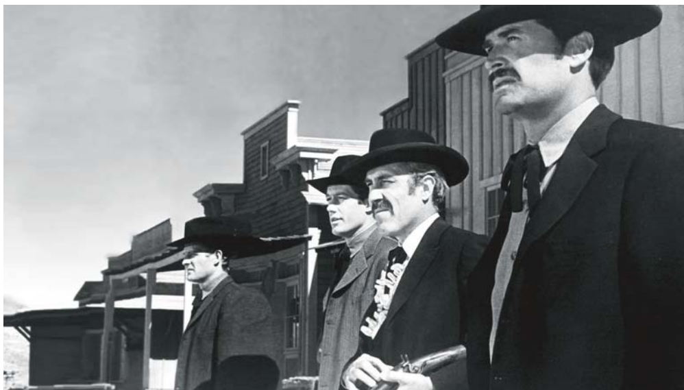
Hour of the Gun de John Sturges (1967)

Qui ne connaît pas l'histoire de Wyatt Earp et de Doc Holliday ? Enfin, à peu près, car nous la connaissons surtout par le cinéma, et les nombreux films l'ayant mise en scène sont autant de variantes d'une histoire réelle, dont le point culminant narratif est le règlement de comptes à O.K. Corral. Le fil conducteur de cette histoire est une amitié surprenante entre un marshal droit dans ses bottes et un hors-la-loi alcoolique et tuberculeux. Dans les reprises successives de ce schéma, la nature de leurs rôles respectifs va parfois changer, témoignant de ce qui fait la force même du Western : peu importe que l'on reprenne sans cesse la même histoire (ce qui de toute façon est inévitable après deux mille ans de récits derrière nous, comme le dit si justement Walter Hill), du moment que celle-ci résonne, quelque part, avec son époque.