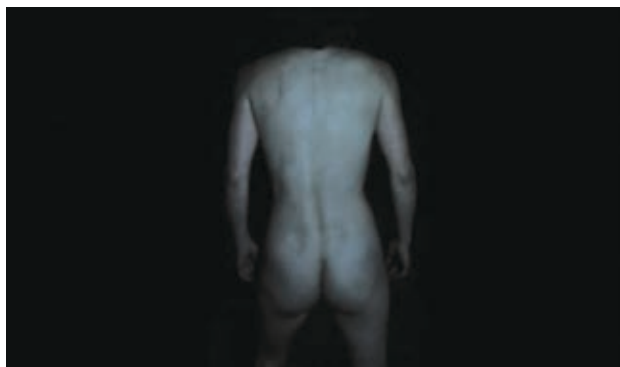
WHITE EPILEPSY (2012)

* Cette rétrospective, présentée conjointement par le FNC et la Cinémathèque québécoise, aura lieu du 11 au 17 octobre 2012.