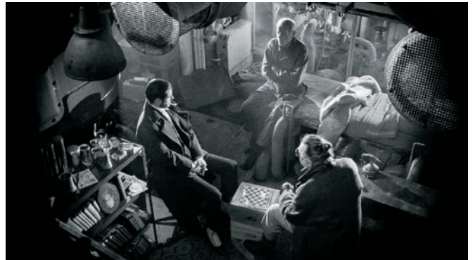
9 doigts (2017)

lorsqu'ils se rendaient en Amérique, puis au Cap-Vert lorsqu'ils revenaient. Dans ma jeunesse, j'ai été marqué par l'alchimie, par cette idée qu'il existe un centre du monde – et pour moi, les Açores représentent un peu ce centre du monde. L'Atlantique est un peu la Méditerranée moderne.