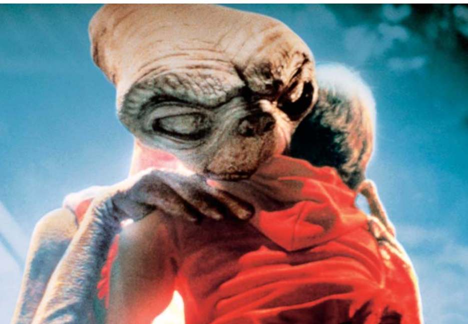
E.T. de Steven Spielberg (1982)

Dans cet art de la manipulation qu'est le cinéma (et dans l'art en général), l'effet de réel a toujours été la source de nombreux clivages. Voir la grande problématique de Platon et sa caverne, là où confortent et divertissent des ombres chatoyantes d'un réel extérieur bien plus complexe et inquiétant. De ce fait, en termes d'esthétique et de narration, beaucoup de choses ont changé dès la fin des années 1980. La roue a tourné et, indéniablement, les émotions en ont pris un coup. Du côté du cinéma d'auteur, l'influence des frères Dardenne se retrouve partout, surtout chez les jeunes cinéastes et ce, encore aujourd'hui. C'est le grand retour à un cinéma dit plus « dramatiquement vrai », plus « social ». Finie l'esthétique des sentiments. Finie l'influence de la pub et du vidéoclip. Terminée la musique qui