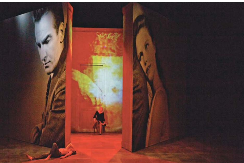
Erich von Stroheim, créé au Théâtre national de Strasbourg et repris au Théâtre du Rond-Point, 2017 Photo tirée du film Le fleuve sauvage d'Elia Kazan

sa propre création. Je crois que, moi aussi, j'essaie de trouver une place de cet ordre-là, c'est-à-dire me nourrir absolument de tout ce qui m'entoure sans être pour autant un imitateur qui reproduirait un geste qu'il a admiré.