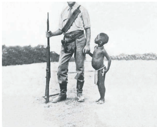
Élément de Inner Sanctum (1995), Collection MNBAQ

Dans les années 1970 et 1980, il y avait encore plusieurs salles de cinéma à Montréal qui présentaient des films d'auteur des quatre coins du monde. J'ai eu plusieurs coups de cœur au cinéma Élysée : Ettore Scola, Tati, Kieslowski. J'ai vu mon premier Woody Allen au Cinéma 5 et Tarkovski au Cinéma Parallèle. J'ai eu la chance de voir It's A Wonderful Life de Capra à la Cinémathèque française à Paris, Harvey de Henry Koster au cinéma Regency à New York, Sherlock Jr de Buster Keaton au Silent Movie Theater à Los Angeles qui, par miracle, existe toujours. Visionner ces films dans de tels lieux, en copie très souvent impeccable, rendait l'expérience encore plus magique, comme un moment figé dans le temps.