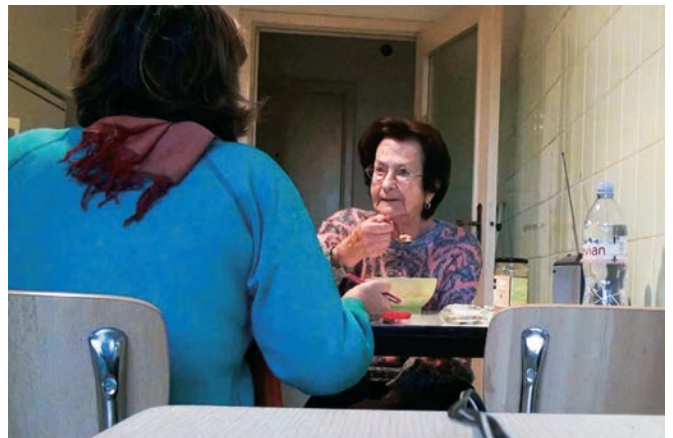
No Home Movie de Chantal Akerman (2015)