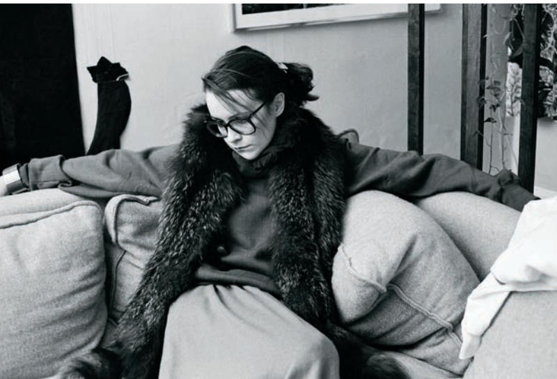
Autoportrait aux renards (1979) – extrait de Mon regard est net comme un tournesol (2011)