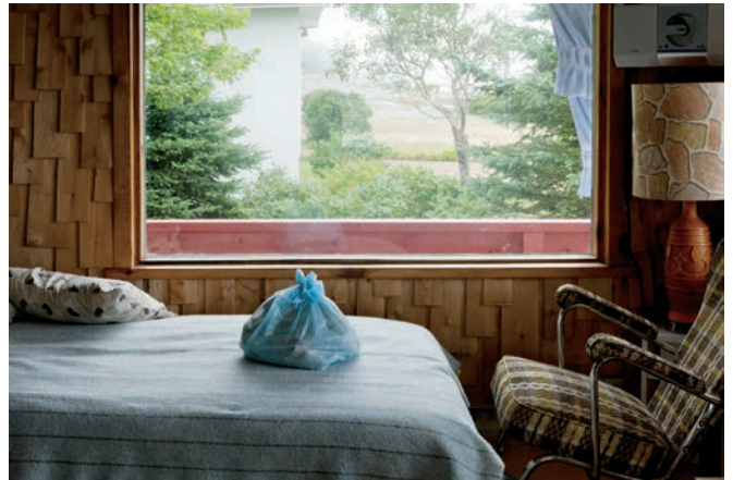
Sac bleu – extrait de La maison ou j'ai grandi (2013)