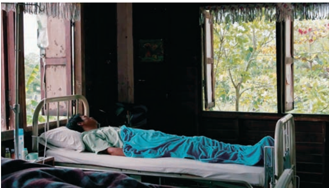
Cemetery of Splendour d'Apichatpong Weerasethakul (2015)