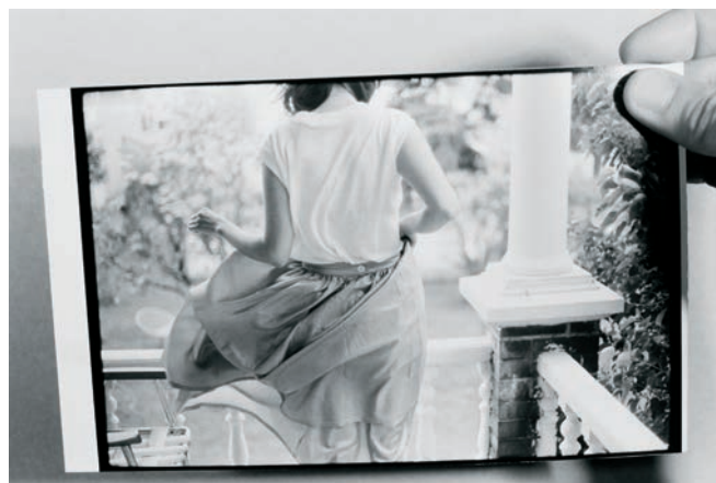
Jupe bleue (2000) – extrait de Mon regard est net comme un tournesol (2011)

Je me souviens de films que je n'ai peut-être jamais vus. Je me rappelle l'atmosphère, les couleurs, les extraits à la télé, les photos dans un magazine. J'aime suivre le rythme d'un film, voyager dans son espace, mais j'oublie souvent comment ça finit. On se souvient de la personne avec qui on voit un film, paraît-il. Je me souviens aussi des salles, des circonstances. Ben Hur au théâtre Princesse à Rivière-du-Loup, Pour la suite du monde au ciné-club du Cégep. À Paris, à l'Entrepôt, je rencontre Jeanne Dielman, Maria Malibran, Kaspar Hauser et visite l'« Ambassade de France aux Indes » ; de retour à Québec, on va voir La maman et la putain au cinéma Cartier et on assiste à la première des Plouffe au Cinéma de Paris. Et puis à Montréal, je suis une fidèle des marathons du Cinéma