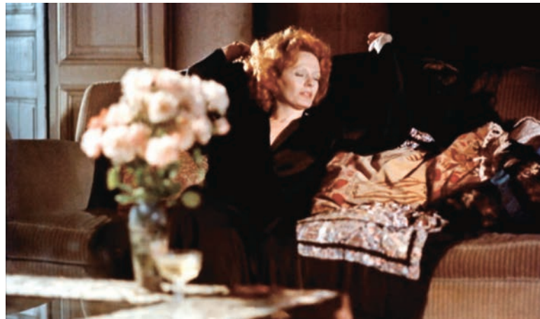
India Song de Marguerite Duras (1975)