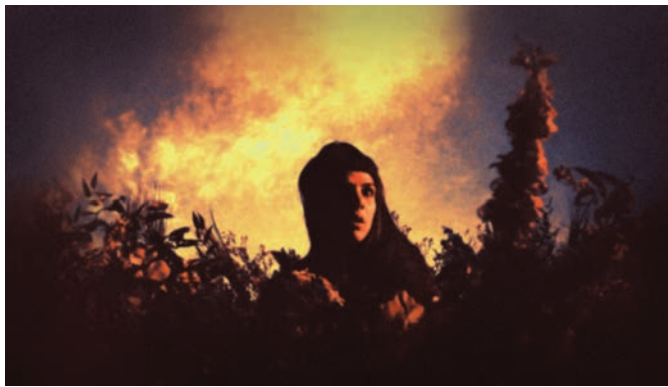
The Forbidden Room (2015)