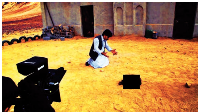
Bring Me the Head of Tim Horton (2015)

Entretien effectué au Festival du nouveau cinéma, octobre 2015