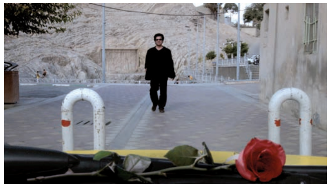
Taxi Téhéran (2015) Jafar Panahi