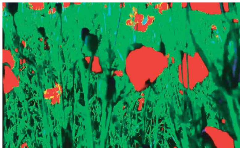
ADIEU AU LANGAGE (2014) Jean-Luc Godard

eux. Peut-être suffisait-il à Monica Vitti d'être aussi belle pour que Antonioni imagine Le Désert rouge . Peut-être croyons-nous, à cause de l'extrême sidération provoquée par la surprésence industrielle de tous ces produits injectés de force dans nos regards et nos cerveaux , que cela n'est plus possible. Mais ce n'est pas vrai. Le temps s'est tellement accéléré que l'histoire, aussi, s'accélère. Ce qui hier prenait plusieurs siècles pourrait surgir tout à l'heure en quelques années.