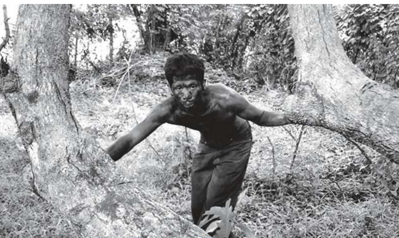
DEATH IN THE LAND OF ENCANTOS (2007) Lav Diaz