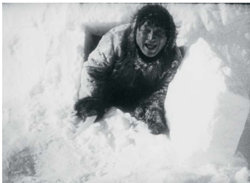
NANOOK OF THE NORTH (1922) Robert Flaherty