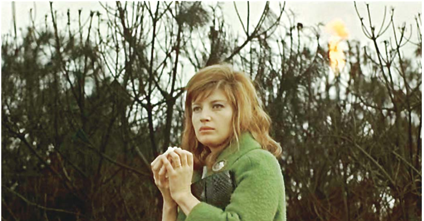
LE DÉSERT ROUGE (1964) Michelangelo Antonioni

1 Impossible de parler de cinéma sans parler de Révolution. Celles qui ne sont plus, celles qui ont lieu sous nos yeux, celles qui arrivent. C'est le cœur même du cinéma. La manière dont le cinéma accompagne le monde d'une époque à une autre, d'un monde à l'autre. La nature révolutionnaire du cinéma est incontournable. Révolutionnaire, comme l'art et l'industrie. Le cinéma ne tient pas en place, jamais. Il ne tient pas en place, parce qu'il puise son existence dans la technique. Et principalement dans les révolutions de la technique. Celles qui ont donné le cinéma muet jusqu'au téléchargement, la diffusion sur Internet, et déjà, au-delà.