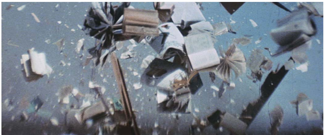
ZABRISKIE POINT (1970) Michelangelo Antonioni

« Mouvement spontané dont la nature même contournerait les salles de cinéma et dont la puissance pourrait briser l'esclavage de l'actualité cinématographique en la redéfinissant entièrement. »