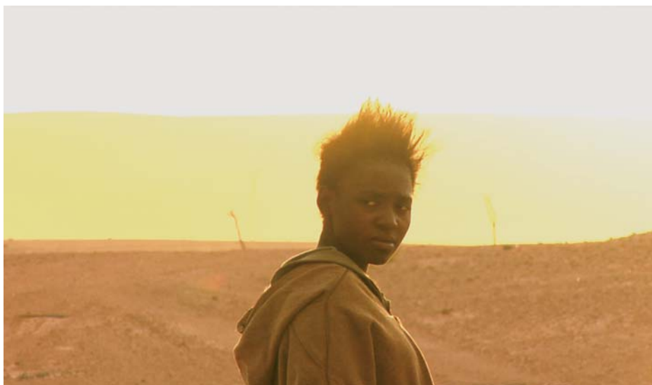
INLAND (2008) Tariq Teguia

Le spectateur-cinéophile par exemple. Reste-t-il seulement pour nous un vague souvenir ? Une trace sérielle habitant les revues de cinéma, les « vieux films » ? Nos mémoires, nos discussions amoureuses, les livres de cinéma du siècle dernier, les musées ? S'est-il transformé comme on nous l'a martelé en espaces de cerveaux disponibles , en statistiques, pourcentages, catégories, chiffres ? Sommes-nous encore un tant soit peu ses descendants ? Sommes-nous encore un peu ? beaucoup ? pas du tout ? connectés à lui. Nous, dont les regards sont organisés, dirigés, occupés, par toutes sortes de stratégies de captations médiatiques et industrielles ? Pendant que celui du spectateur-cinéophile découvrait, décennie après décennie, dans des dizaines de milliers de films, l'immensité éblouissante de sa liberté de voir et de penser le monde – seul et avec d'autres – comme pour la première fois .