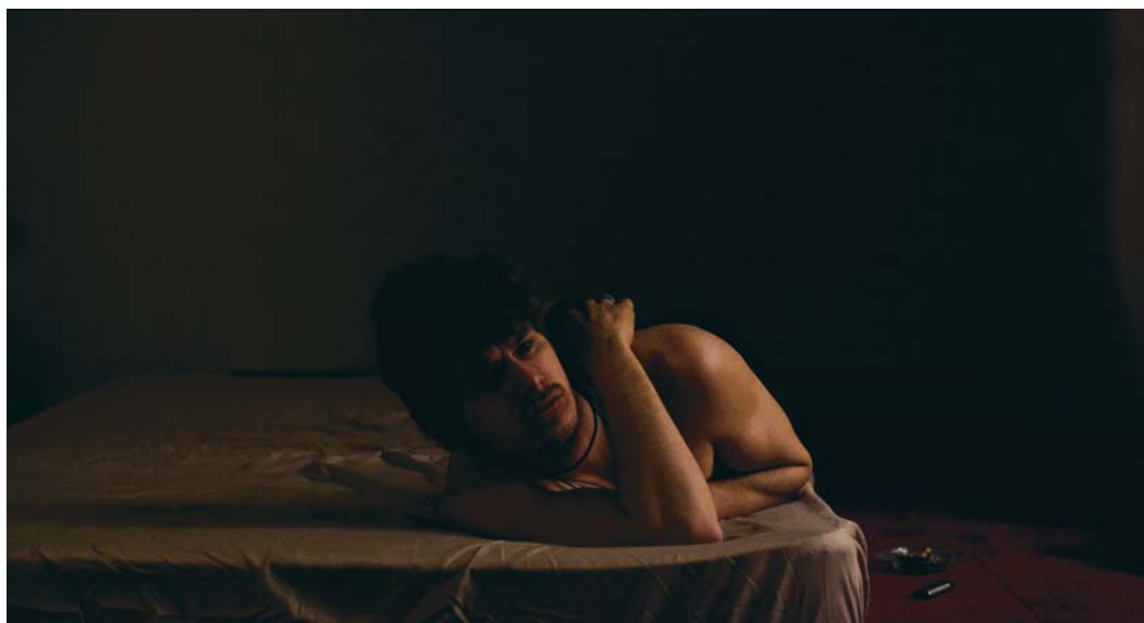
Alex dans L'AMOUR AU TEMPS DE LA GUERRE CIVILE