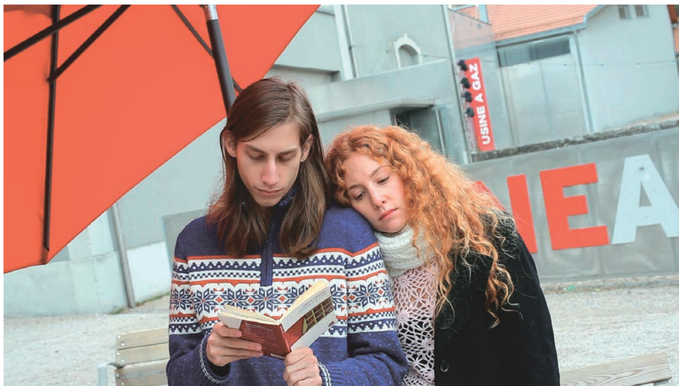
ADIEU AU LANGAGE de Jean-Luc Godard

IL N'A PAS FALLU ATTENDRE LA DÉCLARATION DU MAÎTRE POUR S'EN RENDRE COMPTE : À CANNES, CETTE ANNÉE, le plus vieux cinéaste de la compétition officielle proposait le film le plus jeune. Ce dernier commentait bien entendu la décision (inédite) du jury du Festival de Cannes d'accorder le Prix du jury conjointement au plus jeune et au plus vieux cinéaste de la compétition, décision charmante, un tantinet consensuelle certes, qui n'aura cependant pas manqué de susciter bien des réactions. L'une d'elle donc, celle de Jean-Luc Godard, qui avec sa liberté de parole désormais coutumière (et son goût immodéré pour les jeux de mots) disait : « Regardez ce prix donné à Cannes, à moi et à Xavier Dolan que je ne connais pas. Ils ont réuni un vieux metteur en scène qui fait un jeune film avec un jeune metteur en scène qui fait un film ancien. Il a même pris le format des films anciens. Au moins qu'on dise ça... » 1 . Il est à noter qu'il s'exprimait ainsi après avoir clairement dit qu'il aurait voulu voir le président français nommer Marine Le Pen premier ministre... « pour que les choses bougent un peu. »